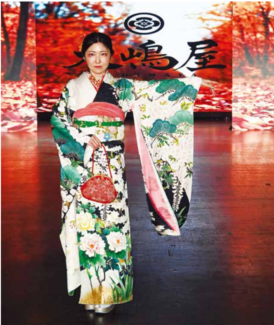
日本着物の美しさを堂々とストレートに見せたランウェイ(8日)

新聞と同じレイアウトで読めるデジタル版 www.nyseikatsu.com 世界のニュースもNYの今が分かる日本語新聞 (フリー) ©All copyrights reserved to New York Seikatsu Press, Inc.