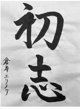
リセケネデイ日本人学校補習校中2 倉本 エリノア