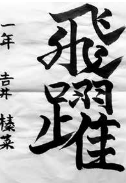
サンアントニオ日本語補習校中1 吉井 榛菜