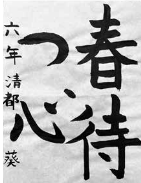
ニューヨーク育英学園小6 清都 葵