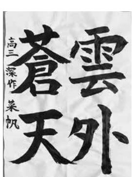
ピッツバーグ日本語補習校高3 深作 菜帆