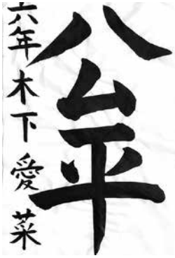
NY小山書道教室小6 木下 愛菜