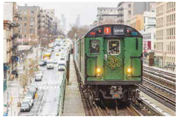
写真家 植山慎太郎

顔面や手、喉頭、腹壁などの移植を「血管化複合組織同種移植(VCA)」とよび、血管と血管を縫い合わせることで血流を再開させる必要がある。さらに神経、筋肉、骨などをつなげることも必要で、機能の再建も可能となる。一方で非常に高度な知識と技術が求められる。「日本では、臓器移植に関する法律(臓器移植法)で、心臓、肺、肝臓、腎臓などの移植は認められていないが、現時点で顔面や手などの移植は認められていない。さらに日本人の死生観、脳死を人の死として受け入れることへの抵抗感、臓器移植の制度の問題もあり、日本の臓器提供者数は米国、スペイン、韓国などの他国と比べて遥かに少ないのが現状である」と平山医師。日本人は遺体に傷をつけることを嫌がるが、例えば移植医療の進んでいる米国の場合、自分や家族の死が、臓器を提供することによって多くの人の命を救