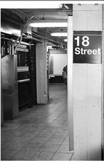
事件があった18丁目地下鉄駅のホーム

しい地下鉄車両やバス、2番街地下鉄の大規模プロジェクトなどに充てられる。マンハッタン60丁目の車道で日中9ドル(夜間は2ドル25セント)の料金がE-Zパスで課金される。E-Zパスを使わない場合は郵送で請求書が送られるが13ドル50セントと割高になる。渋滞税はロンドン、ストックホルム、シンガポールなどで導入されている。ニューヨークでは数十年に及ぶ議論が続いた。世論調査では市民への負担を強いるものと常に不評だった。昨年6月に開始予定だったのを15ドルから9ドルに下げることになった。今回の導入に踏み切った。今回の導入に踏み切った。今回の導入に踏み切った。