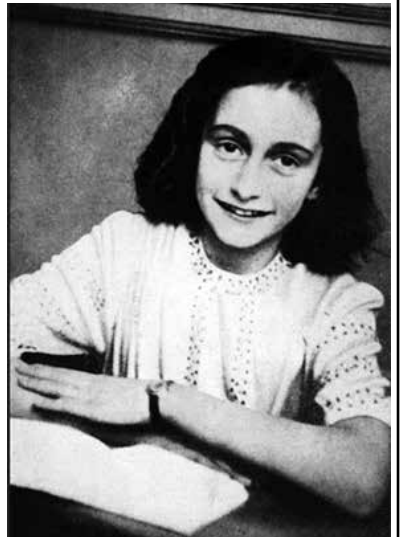
アンネ・フランク

「アンネ・フランク展」が1月27日(月)から、セント・ポー・ザ・ジュニア・ミュージアム(西16丁目15番地)で開催される。第2次世界大戦中のユダヤ人迫害の数百万人にわたる被害者の一人で、世界で最も翻訳されている本の一つ『アンネの日記』を書いたことで知られる少女の短い人生を振り返る。フランク