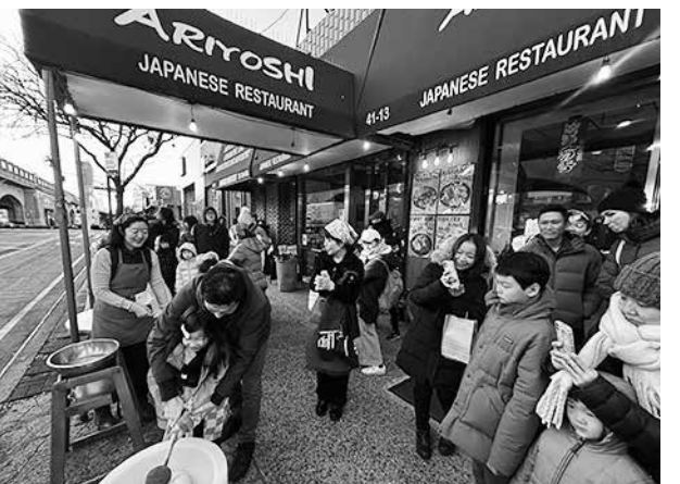
地元の日食レストラン「有吉」が主催