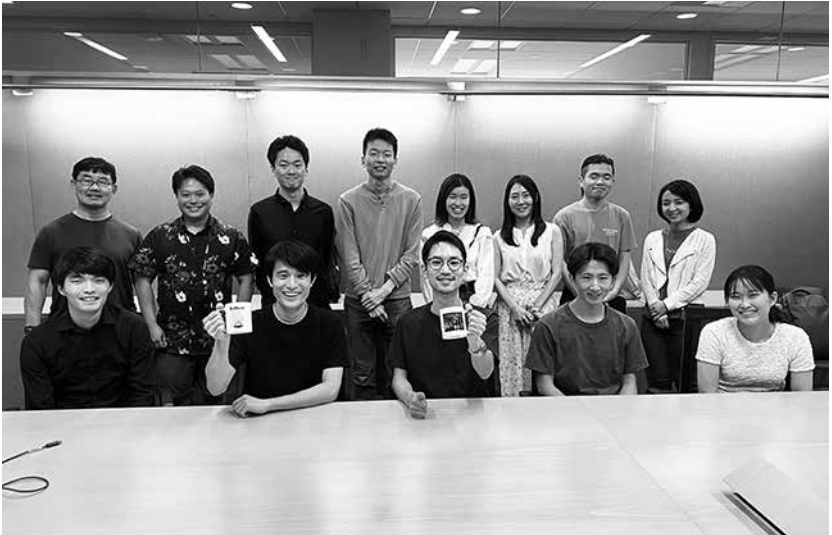
フィラデルフィア日本人勉強会(Japanese Academic Seminar at Philadelphia JASP)は1月25日(土)午後4時30分から、ペンシルベニア

大学医学部の施設内で、ワインの基礎知識を学ぶための講座を日本語で開催する。同会では毎月、参加者の一人が研究テーマや専門分野を日本語で発表する勉強会を開催している。参加者は同大の関係者に限らず、生涯学習として勉強したい日本人であれば誰でも参加可能。今回はワインに詳しい会員が講師となり、赤ワインと白ワインの違いから、ブドウの種類や産地の特徴、食事との相性まで、初心者向けに解説する。参加費は無料。また講義後には実技編としてワインと食事のペアリングも行う懇親会(有料)も実施予定。問い合わせ・申し込みはEメール JASPI118203@gmail.com (伊藤さん) また、詳細はウェブページ https://jasp-japanese-academic-seminar-at-philadelphia-jindosite.com を参照。