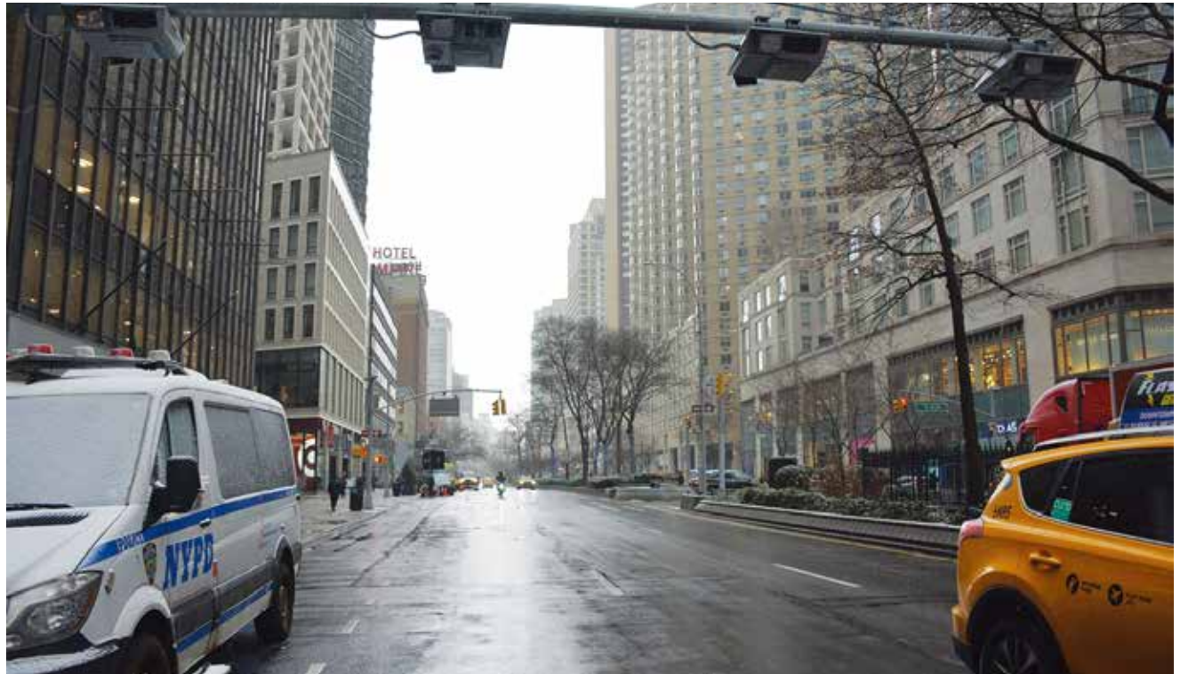
昼前の時間帯、普段は車で混雑するブロードウェイ 60 丁目。上部には課金する装置 (6日午前 11 時 30 分)