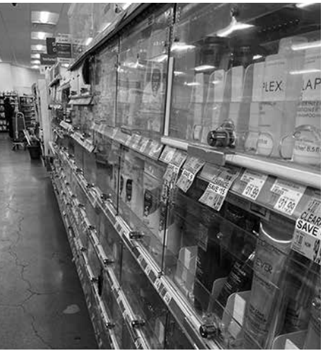
防犯ケースの鍵がかかった棚

昨年、NY市内のドラッグストアの約10%が閉店したことが、マンハッタンを拠点に公共政策の調査を行うシンクタンク、センタール・フォー・アン・アーバン・フューチャー(CUE)が公表した年報「ステート・オブ・ザ・チエーンズ」で分かった。大手ドラッグストアのチエーン、ウォルグリン、デュアン・リード、CVS、ライト・エイドの市内店舗数は、ピーク時2014年には656店舗だったが、23年は435店舗、そして昨年は395店舗に減少した。最も閉店の打撃を受けたのはデュアン・リードを運営するウォルグリンで、211店のうち22店舗が閉店、次のCVSは160店のうち10店舗、そして23年に倒産保護を申請したライト・エイドは8店舗が閉店し、現在はわずか46店舗が営業を続けている。10年間で約40%が閉店に追い込まれた原因のひとつとして、同報告は横行する万引きを指摘している。犯罪自体だけでなく、防犯対策として多くの店舗が、薬だけでなく日用品までも鍵付の透明な棚に並べるなどし、従業員の対応なしでは手に取れない手段をとっている。さらにセルフレジ員が増え、対応する従業員が少なくなっているため、客は面倒を避けるためにネット通販で購入する傾向にあるという。