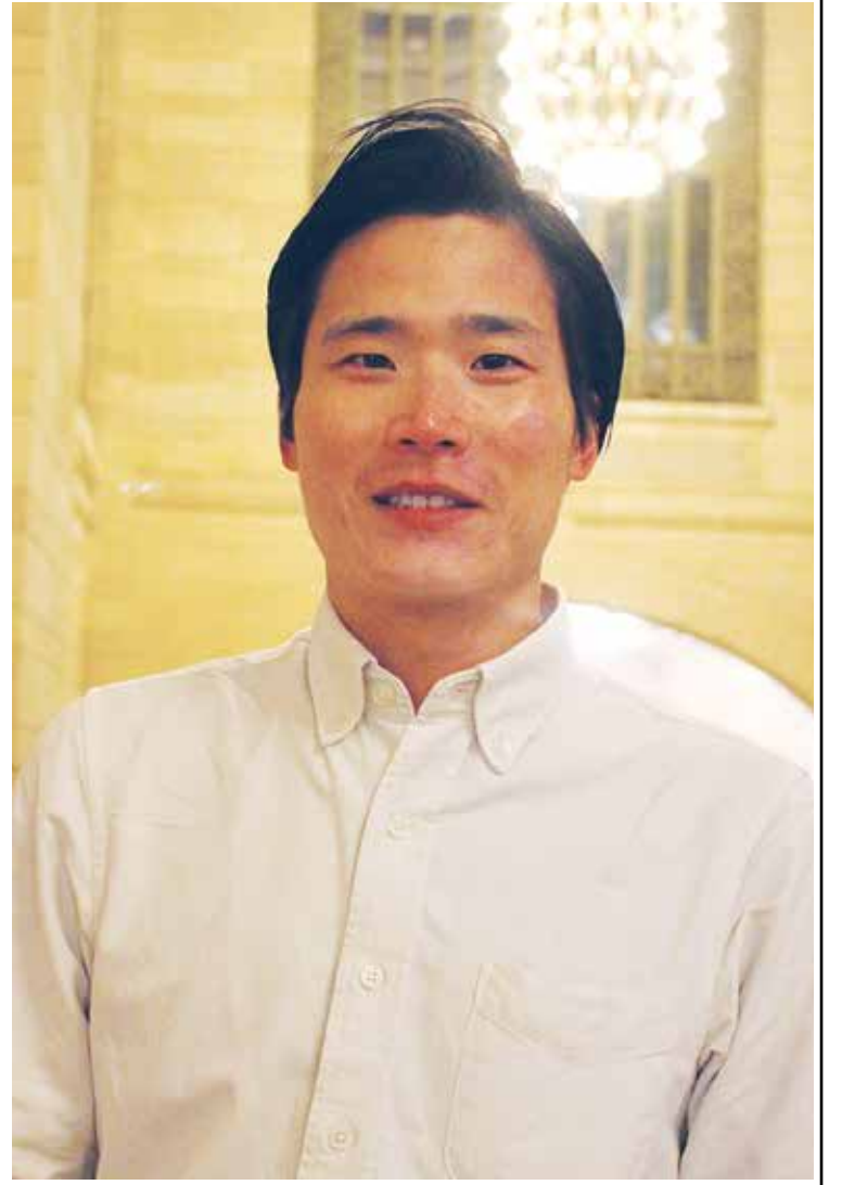
ランゴン医療センターに留学中の医師