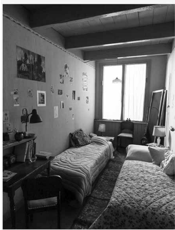
Reconstruction (2020) of Anne Frank's room in the Amsterdam hiding place where she wrote her famous diary.

アムステルダムでの幼少期からアムステルダムへの移住、1944年の逮捕と強制収容所への送還など、その背景に触れる。同展ではアムステルダムのアンネ・フランク・ハウスのコレクション100点を展示されるほか、アンネと両親、ほかに4人のユダヤ人がナチスから逃れるために2年間潜伏していた隠れ家を、アムステルダム以外で初めて原寸大で再現する。被害者としてではなく、ひとりの少女として、作家として、そして回復力と強さを