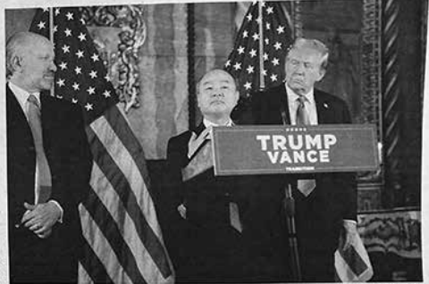
Masayoshi Son of SoftBank appeared at a news conference with President-elect Donald J. Trump on Monday.

The investment announced Monday is likely to be focused on the infrastructure needed to support the A.I. boom. Via energy