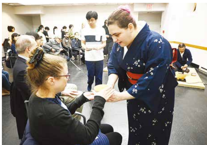
裏千家茶の湯センターの協力で、日本語を学ぶ学生たちが中心となって開催した茶道のお手前（12月3日、ハンターカレッジで）