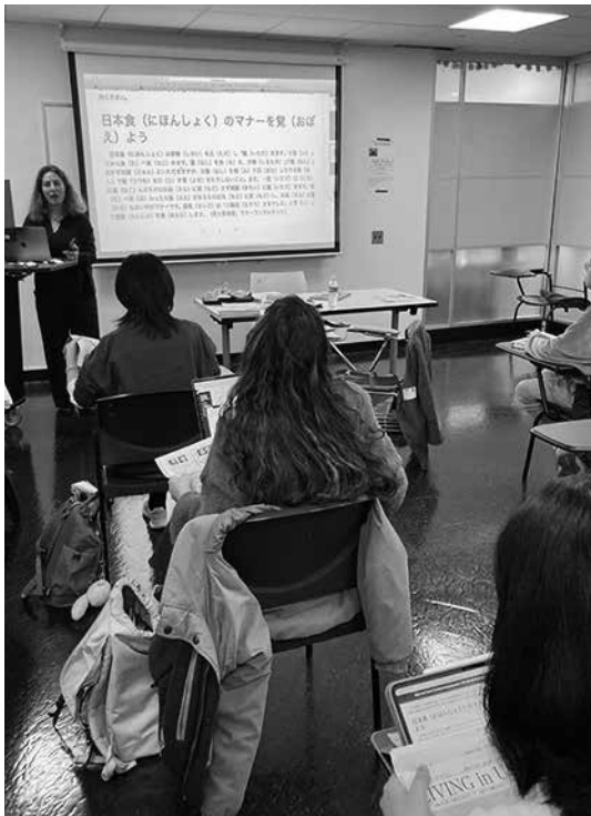
本紙の「週刊やさしいにほんで生活」の記事を教材に授業する日本語日本文化科の学生たち(10月27日)