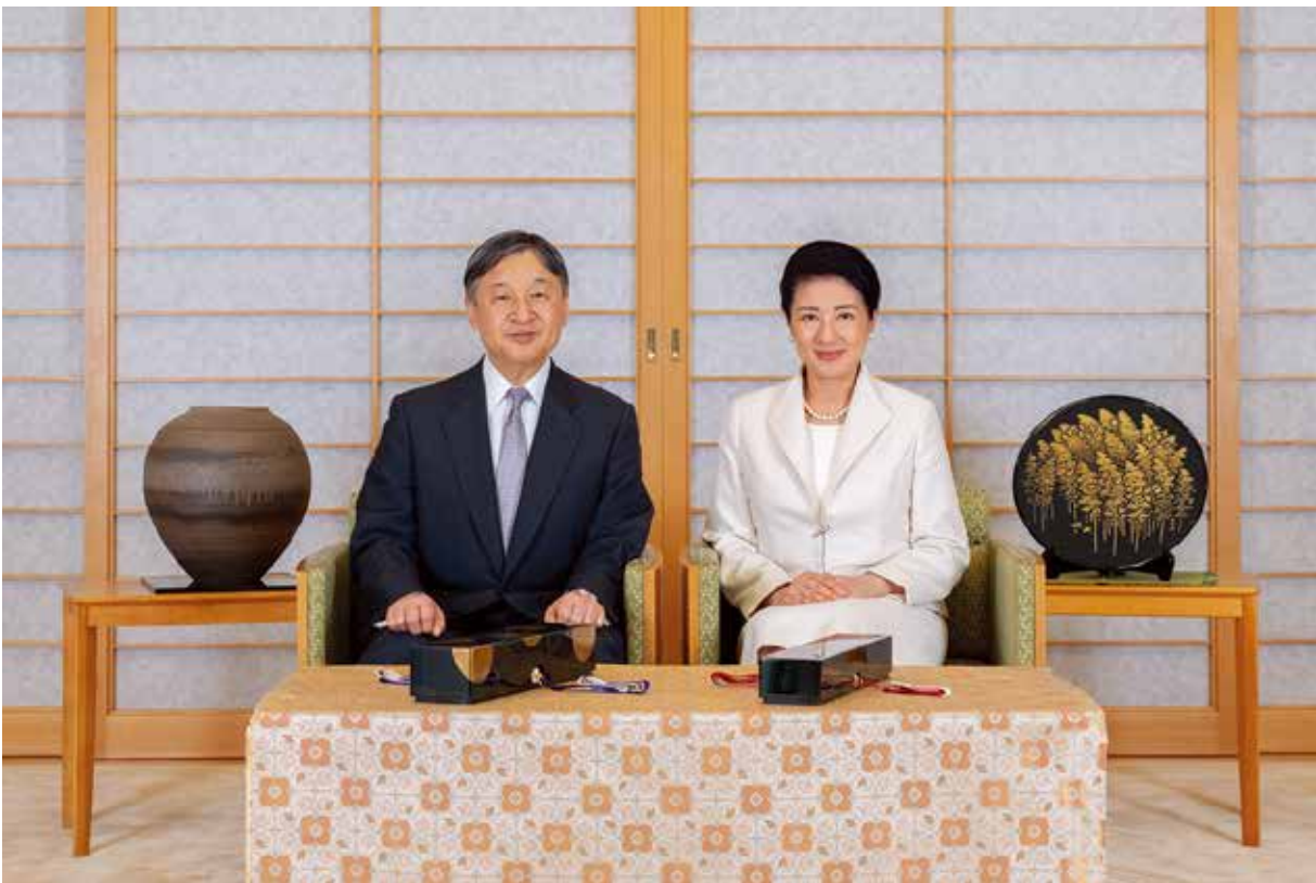
御所にて