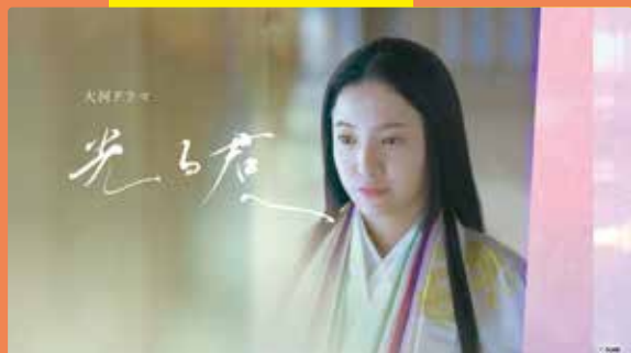
大河ドラマ「光る君へ」 全話オンデマンドで!