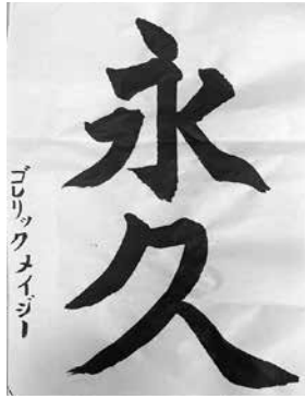
ニューヨーク育英学園全日制小4 ゴレリック メイジ