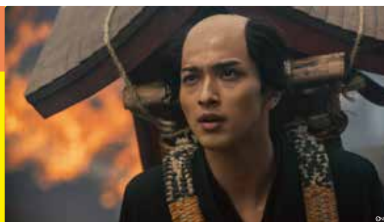
2025年新大河ドラマ「べらぼう」 1月5日スタート!