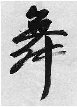
フロリダ州一般 村上 舞