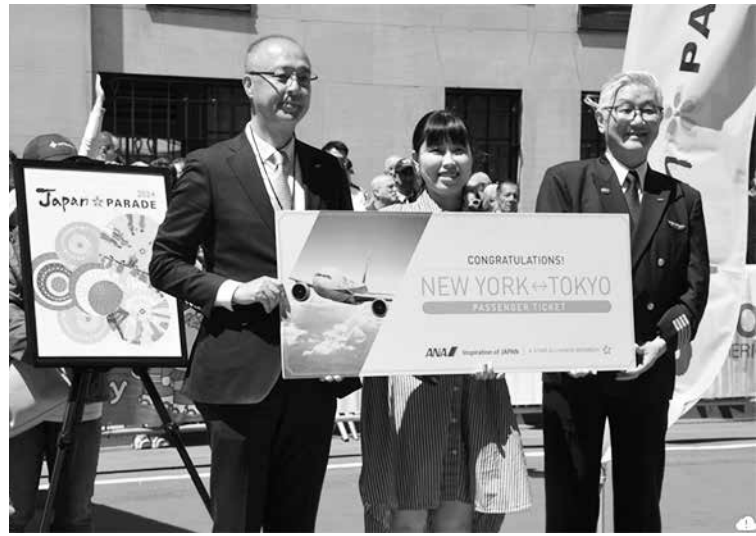
今年の入賞者発表

ジャパンプレレード アートコンテスト作品募集 2025年5月10日(土)1日のメインビジュアルを に開催されるジャパンプレレード