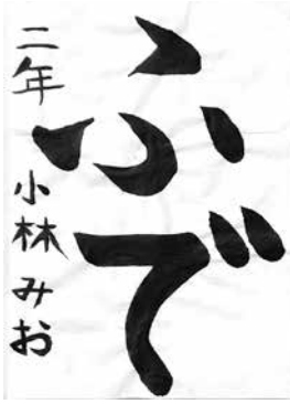
NY小山書道教室小2 小林 みお