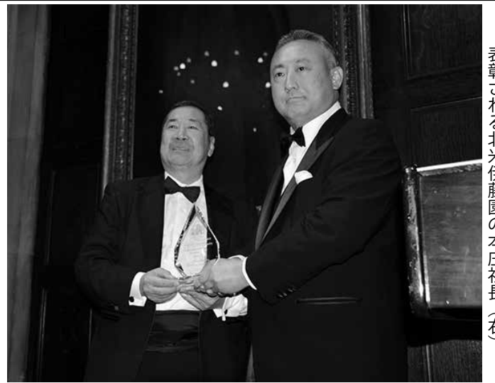
表彰される北米伊藤園の本庄社長(右)