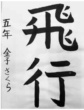
ニューヨーク育英学園全日制小5 金子 さくら