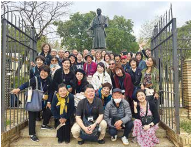
コリア支倉像の前で

伊達政宗が派遣した慶長遣欧使節団がスペインに到着して410年目の節目の今年、宮城県民から参加希望者を募り「令和遣欧使節団2024」として10月16日から9日間スペイン・イタリアの慶長使節団の足跡を辿るツアーが開催された。2019年以降5年ぶりに日本人の血を引く末裔とされるハボンさんたちとの交流も深めた。さらに、新たに合唱団「コロ・はせくら」を結成し、使節団ゆかりの深いコリア・デル・リオ市とチビタベッキア市で現地の市民合唱団と合同演奏会を開いた。この「コロ・はせくら」にニューヨークの合唱団JCH「とも」が加わり、NYから一緒にツアーに参加した。4世紀の時の流れを超えて現代の令和遣欧使節団一行が見たものは何か。