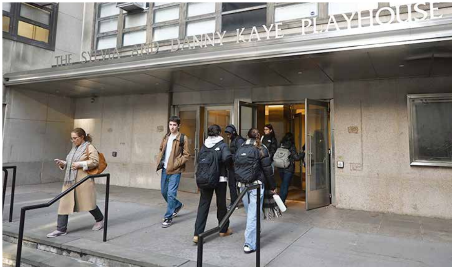
上演会場となる同大内ケイ・プレイハウス