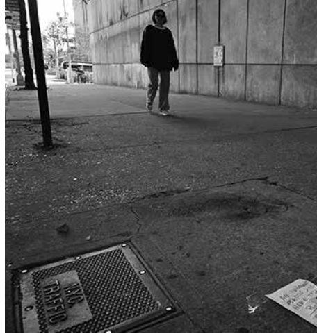
3人目が犠牲となった事件現場

ニューヨーク市のアダムス市長は25日、マンハッタンで3人が死亡した無差別刺殺事件を受けて、精神科治療のため本人の意思に反して入院させる基準を明確化し拡大する必要性がある ながら3か所で通りすがりの3人をナイフで殺害した。過去に何度か犯罪を犯して重篤な精神疾患を抱えていた。 アダムス市長が推進する法案は支援介入法として知られている。同法案は、州精神衛生局が2022年の覚書で示した強制入院に関する指針を成文化するもの。強制入院や裁判所命令による外来治療の要件を緩和する内容で、覚書には本人または他人に差し迫った身体的危害の脅威を与える場合だけでなく、本人が基本的なニーズを満たすことができない場合も精神科治療のために強制的に入院させられる可能性がある」と記されている。