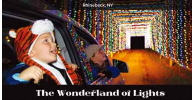
The Wonderland of Lights

今年で4年目を迎えるホリデー電飾イベント。ダッチェス郡ラインベックの広大な原っぱに設置された観覧ルートを車で通りながら電飾と音楽のハーモニーを楽しむ。天候に左右されず、暖かい車内からさまざまなホリデー電飾を見学できるので、小さな子供連れも安心して楽しめる。所要時間は20~30分、停車したり車外に出る事は禁止。会期は12月29日までの木~日曜の午後5時から9時(金土のみ午後9時30分)まで。料金は普通車(8人まで)手数料込みで34ドル60セント。ワンダーランドに行く前にラインベックのチャミングな街並みを散策するのもお勧め。会場 Dutchess County Fairgrounds (6636 Spring Brook Ave. Rhinebeck) https://www.thewonderlandoflights.com/dutchess-county-fairgrounds