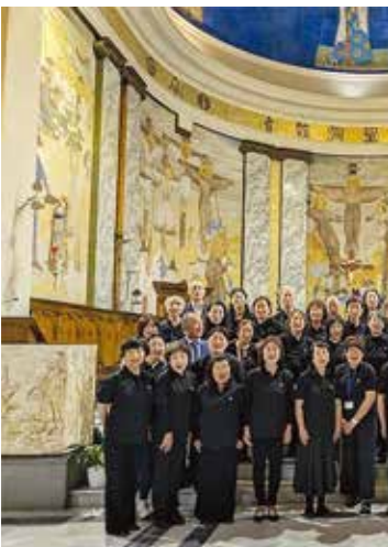
聖殉教者教会でのコンサートの後で。後方の天井には着物を着た聖母マリア(写真上左)と支倉常長(同右)の壁画が描かれている