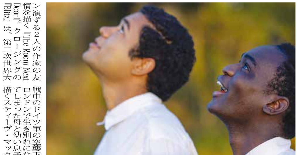
『Nickel Boys』: (c) Photo by L. Kasimu Harris / © 2024 Amazon Content Services LLC. All Rights Reserved.

ニューヨークの映画界で最大の催し物である第62回ニューヨーク映画祭が27日(金)から10月14日(月)まで、リンカーン・センターを主会場にNY市内5区で開催される。世界各国から選ばれたメイン部門の32作品ほか、注目される新作ドキュメンタリー、実験映画、回顧展など多彩な映画を例年のように一挙に上映する。