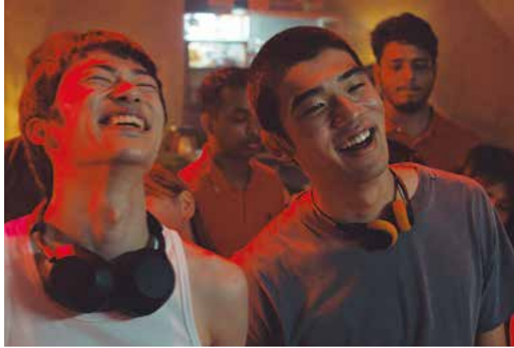
『HAPPY END』

ニューヨークの映画界で最大の催し物である第62回ニューヨーク映画祭が27日(金)から10月14日(月)まで、リンカーン・センターを主会場にNY市内5区で開催される。世界各国から選ばれたメイン部門の32作品ほか、注目される新作ドキュメンタリー、実験映画、回顧展など多彩な映画を例年のように一挙に上映する。