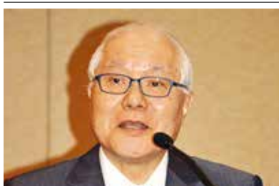
冒頭挨拶をする武見厚労相

武見厚労相がスピーチ NYでグローバルヘルス会議 発足から1年となる「グローバルヘルス」のためのイニシアティブ(「GHI」)のイベントが9月24日、NY市内のウエスティンホテルで開催され、日本代表として武見厚労相がスピーチした。