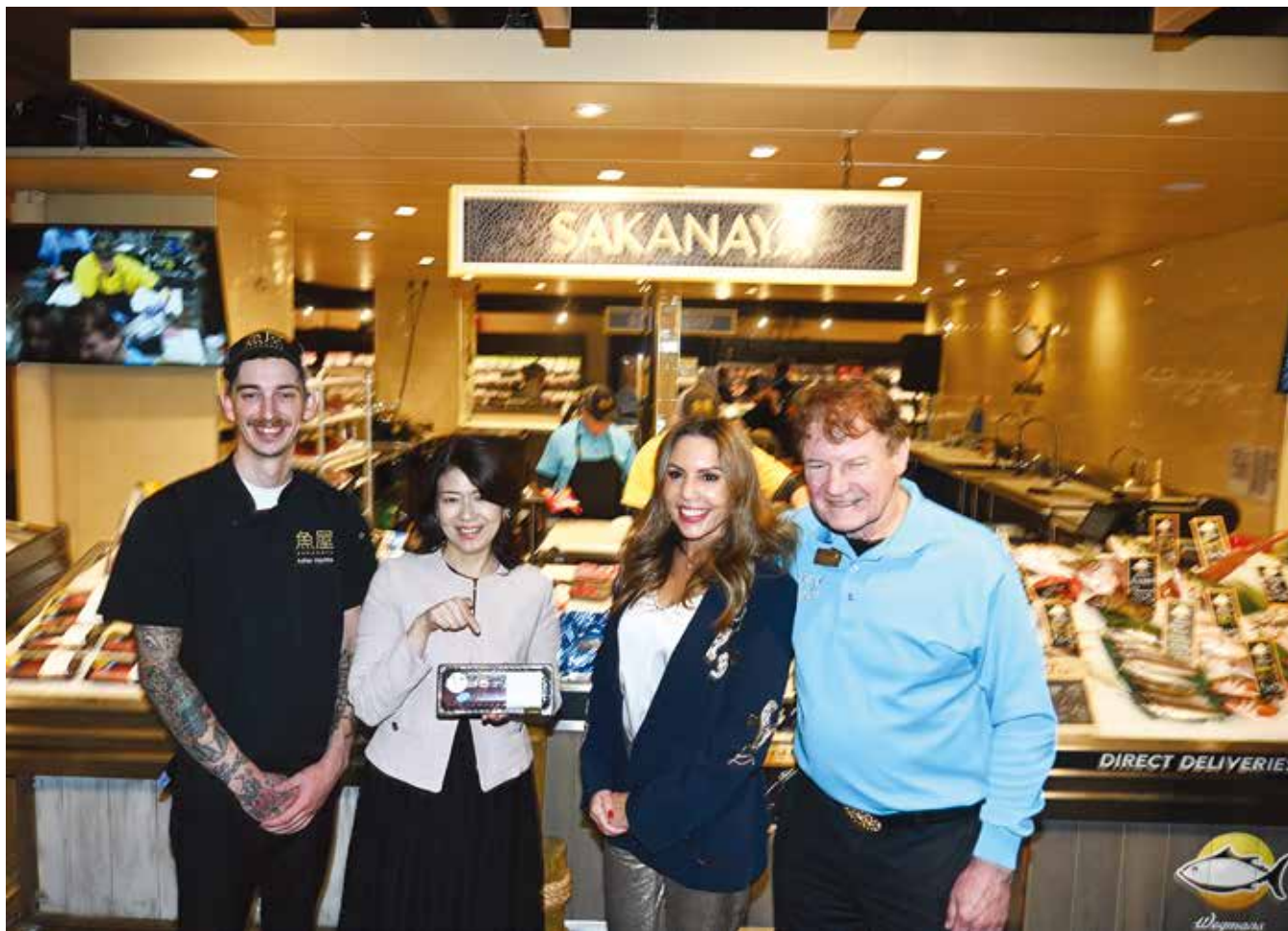
左からマグロを解体披露した職人エイドリアンさん、首相夫人、ポーラ夫人、ウェグマン会長 (22日午後)

新聞と同じレイアウトで読めるデジタル版 www.nyseikatsu.com 世界のニュースも今が分かる日本語新聞 (フリー) ©All copyrights reserved to New York Seikatsu Press, Inc.