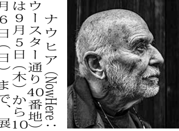
作品画像: Vogue, Nina Ricci, 1965, Paris (Moulin Rouge), France ポートレイト: copeterknappnorthsoutheastwest.eventbrite.com

ナウヒア (Nowhere: ウィスター通り40番地) は9月5日(木)から10月6日(日)まで、展覧会「North South East West - Peter Knapp unites the world with his fashion photography」を開催する。1931年、スイスのベルツヴィルに生まれたピーター・ナッパは、チューリッヒの美術大学で学び、バウハウスの思想と美学に影響を受け、タイポグラフィ、ロゴデザイン、カラーやポスターのデザイン、舞台美術などさまざまな分野で活躍。59年、伝説的な編集者エレーヌ・ラザレフが当時最も革新的だったファッション誌「ELLE」のアートディレクションにナッパを起用した。日本で