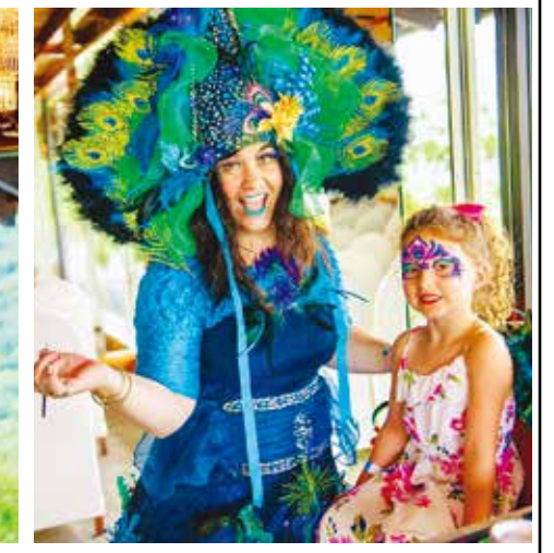
フェースペイントでニコリ