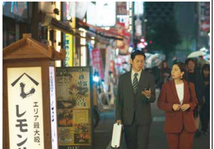
ヒデキは婚約者の上司ケイコを説得して渡米するが...

った」と語った。同作品はサラリーマン・フィルムによって製作。配給会社パルディーが8月30日から9月6日まで米国で劇場公開する。ニューヨークロケは次の通り。▽ニューヨーク 8月30日(金)と31日(土) 午後7時 AMCエンバヤア25劇場(タイムズスクエア)ではプロデューサーのブリガム・テイラー氏、俳優のロビン・ワイガートとゴヤ・ロブレスが舞台挨拶とQ&Aに出席する。▽ロサンゼルス 8月30日(金)と31日(土) 午後7時 AMCバーバンク16ではマーク・マリOTT監督、藤谷文子、スカウト・スミスが舞台挨拶とQ&Aに出席する。