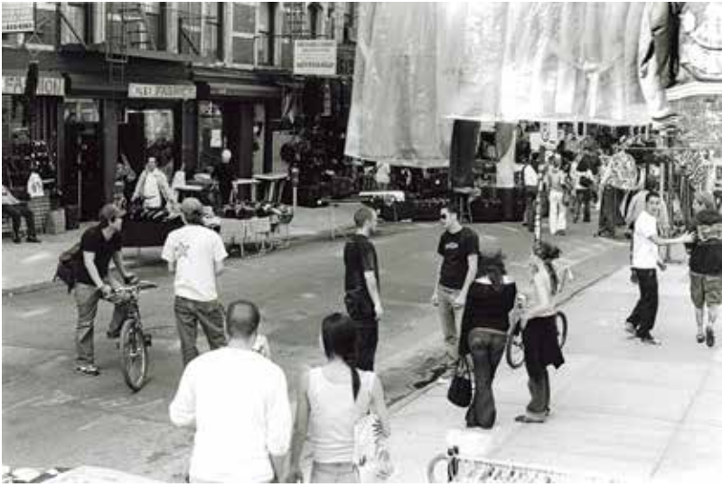
Orchard Street, 2003