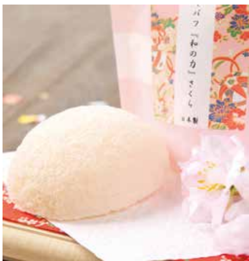
合成着色料や香料、防腐剤なども一切不使用。

安心の100%ナチュラル、日本製の洗顔用こんにゃくスポンジ。山本農場(群馬県富岡市)が国産こんにゃく100%で一つずつ手作りしています。強い保水力で、表面がバリアのように水の膜で覆われ、繊維とお肌が直接触れ合うことを防ぐため、デリケートなお肌を傷つけません。