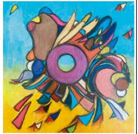
Miho Hiranouchi, Seed wings for the future