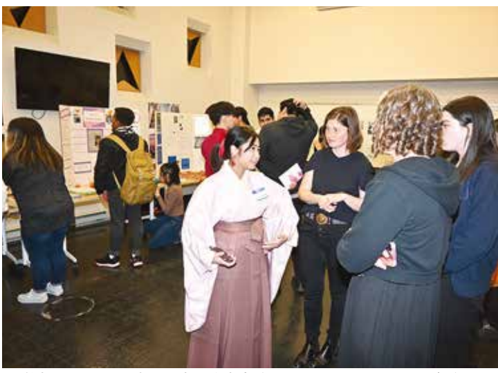
学生たちによる日本語研究の発表会(5月9日、ハンターカレッジで)

在米日本国大使館は今年2月、米国で日本語学習者が約1万7000人いると公表した。また国際交流基金の調査によると教育機関は2018年に米国で1446あったが21年には1241と205機関が減少したものの、日本語教師数は、2018年の約4000人から21年には約4100人に増加した。「日本語学習の目的」は別表IIによると、日本のポ