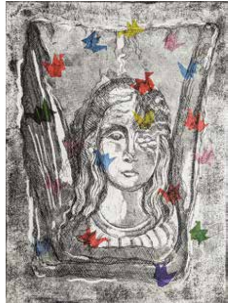
Vassilina Dikidjjeva, Nagasaki Angel - 2