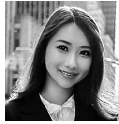
ジェトロ・ニューヨーク事務所は8月19日(月)午後8時から、2024年米デジタルマーケティング最新線・潜在顧客にリーチするマーケティング施策・事例」と題したウェビナーを行う。長期化する円安と日本への関心拡大に

業安全保障局(BIS)は7月25日、国家安全保障の確保と人権保護を目的に、懸念される外国の軍事・インテリジェンス・安全保障サービスに対する輸出、再輸出、支援などを制限する規則案を発表した。米カリフォルニア州、ホームレスの路上生活の拠点の撤去にかかる知事令を発令(サンフランシスコ発) 米カリフォルニア州のギヤビン・ニューサム知事(民主党)は7月25日、ホームレスの路上生活者の拠点の早期撤去に向けた知事令を発令した。知事令は、連邦最高裁判所が6月に、公共の場所での路上生活を禁止するオレゴン州グランツ・パス市の法令を容認したことを受け発表されたもの。米「ネタニヤフ首相が米国内でバイデン大統領、ハリス副大統領、トランプ前大統領とそれぞれ会談」(テルアビブ発) イスラエルのベニヤミン・ネタニヤフ首相は米国時間7月24日の米国連邦議会の演説後、25日にジョー・バイデン大統領とカマラ・ハリス副大統領、26日にドナルド・トランプ前大統領と会談した。ビジネス短信の詳細は、ジェトロ北米ニュース7月29日号を参照。問い合わせは、ジェトロNY事務所。Eメール rept@jetro.go.jp