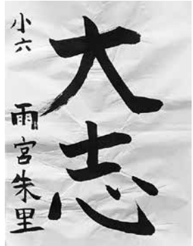
ニューヨーク育英学園 サタデースクール小6 雨宮 朱里