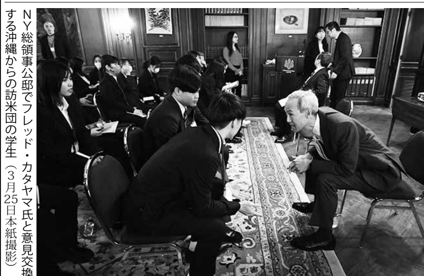
NY総領事公邸でフレッド・カタヤマ氏と意見交換する沖縄からの訪米団の学生(3月25日)

感動の一場面もあった。山口市は、今年1月にニューヨーク・タイムズ紙の「2024年に行くべき52か所」の一つに選ばれたことを受け、ニューヨーク総領事館から自治体国際化協会を通じてパレード参加を要請されていた。パレード当日は伊藤市長ら市職員、山口観光コンベンション協会、湯田温泉旅館協同組合、そして山口県園囃子保存会のメンバー総勢19人がフロイトに乗って行進、県人会のメンバーも一緒に歩いて山口市をPRした。(20面に記事と写真)