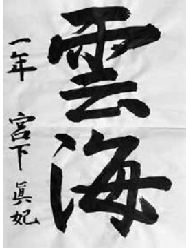
サンアントニオ日本語補習校中1 宮下 真妃