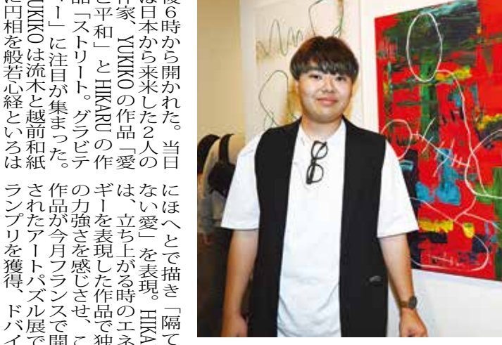
立ち上がるエネルギーを表現する HIKARU

「あの日」は、2011年9月11日のあの朝、高層ビルの窓から肉片が散らばった。地面にリートの破片や粉塵、窓から飛び散る書類が舞うなか、ビルや飛行機の残骸を避け、絶叫しながら、多くの人が川辺まで逃げ切った。 いざというときには、川に飛び込む覚悟を決め、柵を越えて川の目の前に立ち並んでいた。私の友人も、川辺まで走り抜け、途方に暮れていた。やがて訪れたフェリーで、ニューヨーク