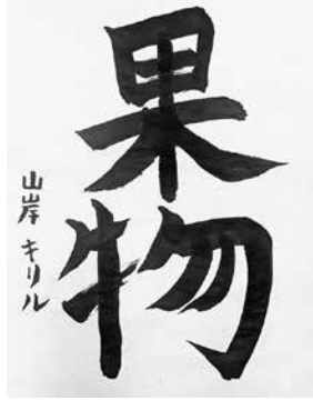
リセ・ケネディ日本人学校 アフタースクール小5 山岸 キリル