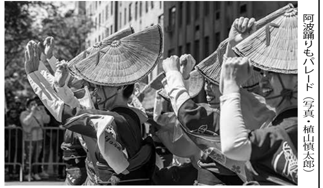
阿波踊りパレード

2024年ジャパンパレード参加団体は次の通り。NY PD 騎馬警官、NY PD カラーガード、NY PD エイジアン・ジェード・ソサエティ、NY PD マーシャルバンド、グラント・マッシュナル国枝慎吾、旗(日本) ハンター大学日本語・日本文化学科、旗(日本) 石川県人会、旗(米国) あおぞらコミュニティ基金、NY 日本総領事館、NY 市長と市機関ハリソン市消防署、日系アメリカ人退役軍人協会、米陸軍士官学校、日本フォーククラブ、紐育太鼓愛好会、寒川神社、寒川神社神輿、ニュージャージー日本入学校、森美樹夫総領事、大使、NY 総領事館、NY 総領事館&フレンズ、国際交流基金NY 日本文化センター、日本航空(フロイト)、NY 廣武館剣道、パークス