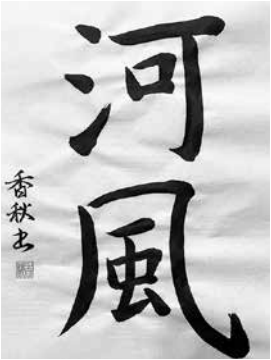
書道教室龍打ハワイ 河上 裕子