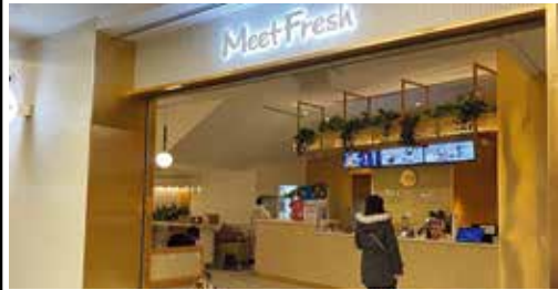
MeetFresh at Tangram

四川や上海、台湾などさまざまな中華料理店が軒を連ねるフラッシングに、数年前にオープンしたショップ「Meet Fresh」が、デザートやスイーツを扱う店舗として注目を集めている。このショップでは、甘さ控えめなデザートやスイーツを提供している。また、台湾デザートショップ「Meet Fresh」では、中国で昔から生薬として漢方薬に使われていた仙草(ゼラニウム)を煮て作る黒いゼラニウムデザートを提供している。また、台湾デザートショップ「Meet Fresh」では、中国で昔から生薬として漢方薬に使われていた仙草(ゼラニウム)を煮て作る黒いゼラニウムデザートを提供している。また、台湾デザートショップ「Meet Fresh」では、中国で昔から生薬として漢方薬に使われていた仙草(ゼラニウム)を煮て作る黒いゼラニウムデザートを提供している。