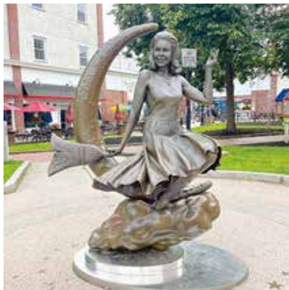
奥さまは魔女のサマンサの銅像