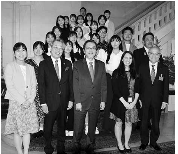
NY総領事の森大使(前列中央)と記念撮影

信するニューヨークの特徴など、説明した後に、今回の海外での体験は、将来に必要となる広い視野を養う上で