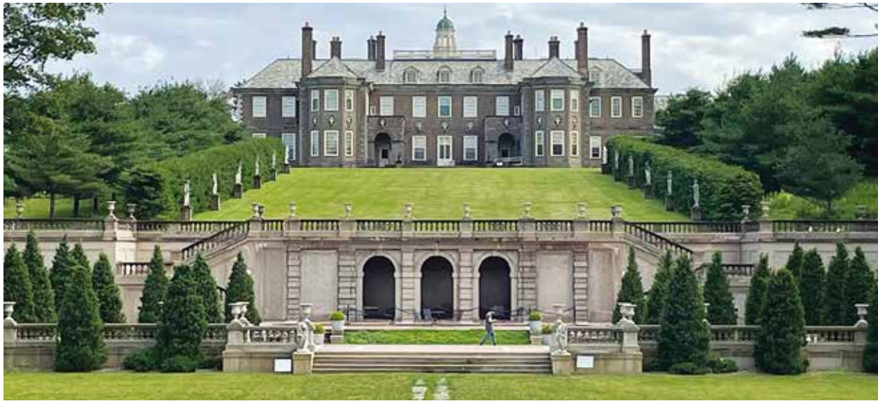
シカゴの富豪のサマーハウスとして使われた邸宅 Castle Hill の全景

この夏、少し遠出をしてマサチューセッツ州まで足をのびしてみませんか？ポストンから車で約40分の港町セーラムは貿易港として栄えた町です。そして、この町は米国の歴史の中でも悪名高い魔女裁判が1692年から93年にかけて行われた町としても知られています。西インド諸島から来た奴隷の話を聞いた少女たちが奇妙な振る舞いを起こし、悪魔に取りつかれたと村人が騒ぎ出したことを発端に始まったと言われています。当時200人近い村人が次々に魔女だと告発され、19人が無実の罪で絞首刑になりました。この事件は米国のける集団パニックの深刻な事件の一つとされ、その後米国の裁判制度に強い影響を与えたと考えられています。映画「クルールシブル」(1996年)はセーラムの魔女裁判を題材にした映画です。そんな恐ろしい歴史のある街で