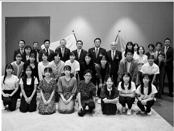
国連代表部で、石兼大使(後列左から5人目)と記念撮影

新潟県南魚沼市の中学生と高校生合わせて19人が米ニューヨークとニューヨーク市を訪問した。