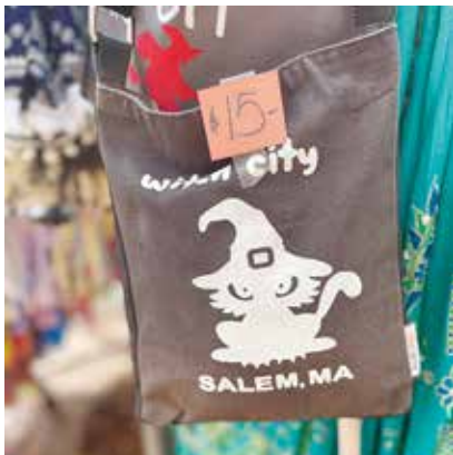
Witch City Salem と書かれた、トートバック