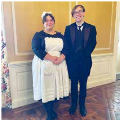
Castle Hill を案内してくれるバトラー