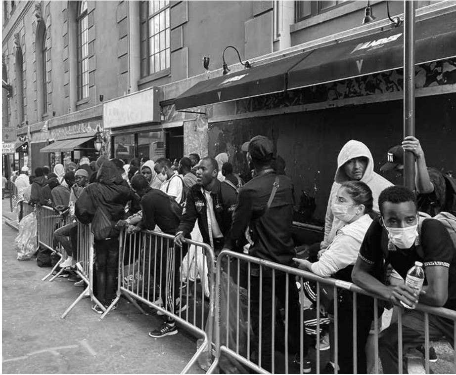
移民一時滞在施設のルーズベルトホテル前では野宿者が続出(1日午前10時)

「移民が屋外で寝るのはもう部屋がないから」とアダムス市長が7月31日の記者会見で同市の移民受け入れ政策が苦境に立たされていくことを明らかにした。問題は、シェルターが不足していることであり、市と協力してその対応に当たっている業者が悪い訳ではないと批判をかわした。市長は、ルーズベルト・ホテルの外の光景が今後、普通に見られる一般的な光景となり、他のシェルターや一時滞在施設として市が借りあげているホテルに波及する可能性がある」と述べた。 アダムス政権が南部国境からの9万人の移民流入への対応に苦慮するが、「NY市は、すべての通りにテントが立ち並ぶような他の都市のようにならない」とも断言した。 同記者会見は、前日にニューヨークタイムズ紙が、移民危機を支援するために市が医療サービス会社