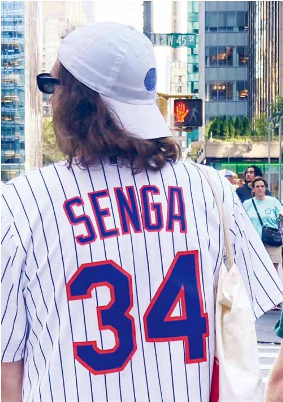
メッツの千賀のユニフォームを来て歩く若者 (7月28日マンハッタン6番街で、写真・三浦良一)

新聞と同じレイアウトで読めるデジタル版 www.nyseikatsu.com 世界のニュースについてもNYの今が分かる日本語新聞 (フリー) ©All copyrights reserved to New York Seikatsu Press, Inc.