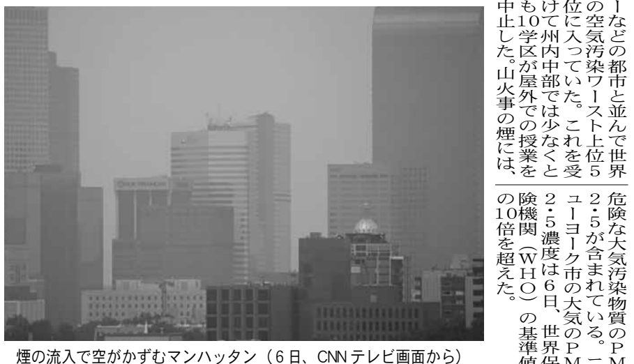
煙の流入で空が曇るマンハッタン(6日)

カナダ山火事の煙が到達 米東部一帯に大気汚染 カナダ東部で発生している山火事の煙が6日午後から1000キロ以上離れたニューヨークを始めとする米東部一帯まで到達し、マニハッタンは同日、普段明るい夕方でも赤茶色に空が染み、薄暗くなった。州当局は、持病がある人に対して外出を控えるよう呼びかけている。外を歩いていると、目がちくちくするようないが街を覆った。地元メディアによると、ニューヨーク州のほか、中西部のミネソタ州やウィスコンシン州 カナダの山火事は、1週間以上渡ってオンタリオ州とケベック州にまたがる東部の一帯で燃え続け、160件以上の火災が報告され、そのうち少なくとも114件は制御不能のまま。17万3000ヘクタール以上の森林が焼失し、約1万人の住民が火災地域から避難している。煙は、米東部を南下している。この煙は、曇り空の原因となるだけでなく、喘息、慢性気管支炎、COPDなどの呼吸器系疾患を持つ人の症状を悪化させる可能性がある。微小粒子状物質を含んでいる。煙にさらされると、目、鼻、喉の炎症、咳、くしゃみ、鼻水、息切れなど、短期的な健康被害が生じる。 ニューヨーク州環境保全局によると、心臓や呼吸に問題がある人、子供や高齢者が特に煙の影響を受けやすいとされている。国立気象局によると、煙にさらされて症状が出やすい場合は、可能な限り屋内にとどまり、外にいる時間は厳密に必要活動に限定するよう注意喚起している。また、全米気象局はニューヨーク市民に対し、自動車ガスを燃やさない、自動車の燃料を燃やさない物など、公害の原因となるもの使用を最小限にとどめるべきだと指摘している。ニューヨーク州消防局によると、7日までに大気汚染警報が発出された。ニューヨーク市は、6日午後の時点で、パングラディッシュのダックラ、インドネシアのジャカルタ、インドのニューデリー