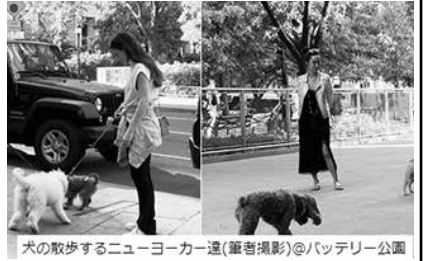
犬の散歩するニューヨーカー@バッテリー公園

らしている。コロナから確かに公園で犬の散歩をする人が明らかに増えた。特にブルックリン住宅街のストリートでも数分ごとに愛犬の散歩をする飼主に遭遇する。そんな中、歩道に放置される犬糞が以前より多くなった(注:NYでの犬糞の放置は、1回につき飼い主に最大罰金259ドル(3万2000円)とNY条例で決められている。街の衛生上に良くないと