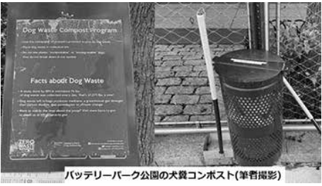
バッテリー公園の犬糞コンポスト

■1日74トンの犬糞をリサイクル NY市の犬の1日の糞量は約74トン、年間で2万7000トンと推計される。NY市では、犬糞をコンポストする肥料プログラムを2019年から推進。いまや各国の行政から注目を集めている。