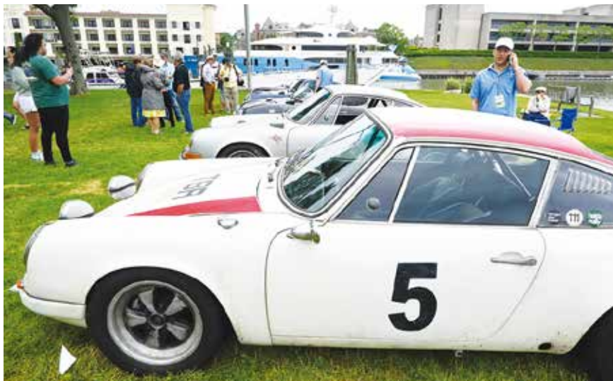
ポルシェの出品台数が圧倒的に多い(上下)が、トヨタのランドクルーザー(左)もマニア垂涎の人気車だ