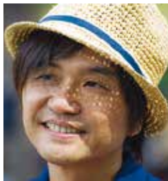
展「アーティスト・イン・ブルックリン」に展示されている。

SAKAIの3作品 展覧会で巨匠と並ぶ 米国、英国、フランス、メキシコ、ポーランド、日本など各地から生み出された現代アーティストなど9人の作品を集めたグループ展「アーティスト・イン・ブルックリン」がニューヨークのマンハッタンにあるミッドタウンのギャラリー「ルードム」(東75丁目)で7月31日まで開催されている。ブルゲンベリアとハウワイの空、透明水彩、透明水彩紙、9x12インチの透明水彩紙がニューヨークのマンハッタンにあるミッドタウンのギャラリー「ルードム」(東75丁目)で7月31日まで開催されている。