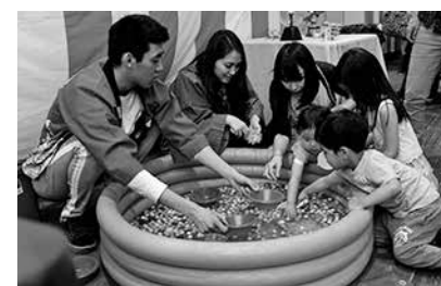
日本クラブが6月3日 親子で楽しむファミリーイベント

第11回日本クラブ「親子で楽しむファミリーイベント」が6月3日(土)午後1時から4時30分まで、日本クラブ(西57丁目145番地)にて開催される。 4年ぶりとなる今回は、まず日本クラブ特製スナック弁当を食べ、その後パフォーミング・ワークショップ、ゲームなどを楽しむ。イベントでは、手巻き寿司、餛飩工やテーブル茶道の実演、フェイスペインティング、ヨー