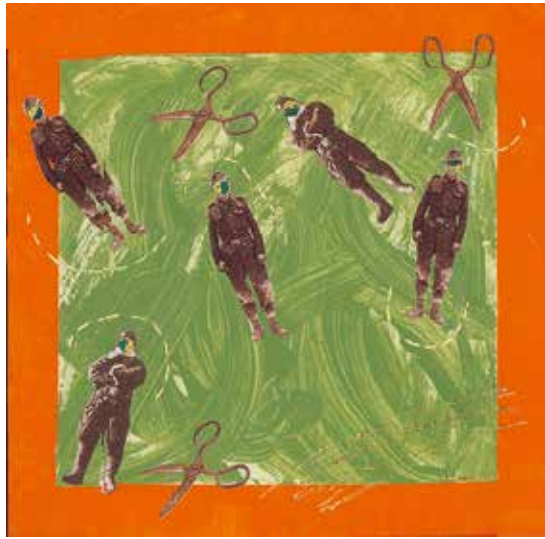
Little Green Apples, 2022, Mixed media, 12" x 12"

ニューヨークを拠点に活動するアーティスト藤原未佳子の初の個展となる「May We Are - 和」が25日(木)から金融街のインターナショナルセンター14階(マンハッタン80番地)で開催される。藤原は同志社大学で心理学、ミシガン州の大学でファインアートを学び、アートと癒しの相関性を追求。2007年からNY日本人美術家協会(所属)、生命・自由・平等をテーマに作品を発表し続けている。今回は、藤原の20年近くに及ぶ制作の軌跡を集約した、満を持しての展示ライナップだ。作品は、木炭・アクリル・コラーージュ・刺繍など、さまざまな媒体が駆使された約10点。会期6月27日まで。開催前日5月24日(水)午後5時から7時にプレビューレセプションが行われる。入場無料。詳細は artsphere.org