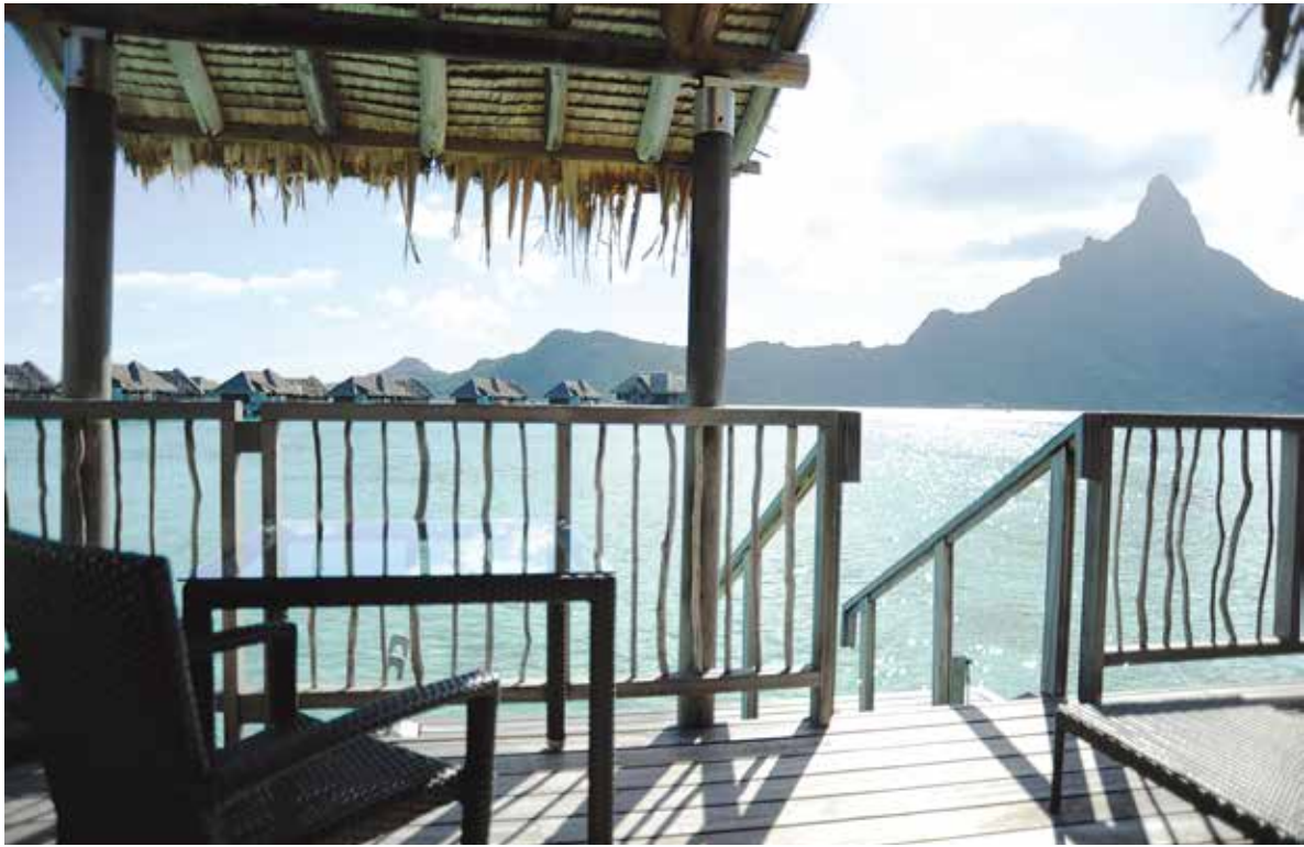
コテージのポーチからオテマヌ山を眺める

2メートルもするサメやスティンレイと一緒に泳げる、淡い碧色の透き通った海水。何百もの熱帯魚に囲まれる入り江。ダイビングは出来なくとも、スノーケリングで十分。海底を体験したいのならここには「ヘルメット・ダイビング」なるものもある。タヒチ島から北西へ約156マイル(260キロメートル)、ボラボラ島は24マイル(40キロメートル)の岩礁に囲まれた一周18マイル(30キロメートル)の人口約1万人の島で、フランス領ポリネシアで最も美しいと言われる。「ボラボラ」とはタヒチ語で「神々によって創造された」と言う意味。