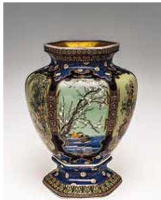
七宝花瓶 林小伝治 (名古屋) 高さ 30.5 cm 1895年頃 (明治時代)

「わかれうとはおもっているけど」は、岸田内閣の「新しい資本主義」の有識者メンバーでもある洪澤健氏(シブサワ・アンド・カンパニー株式会社 代表取締役)が、新しい経済政策や日本の資本主義の将来について解説する。参加費: 一般 $65 (昼食と講演) $20 (講演のみ)、JS会員 $45 (昼食と講演) $15 (講演のみ) 詳細は https://japansociety.org