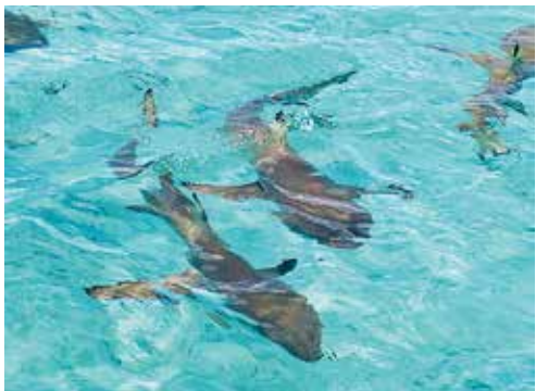
1メートルから2メートルの「本物」のサメの群れと一緒に泳ぐ