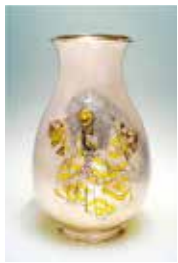
象嵌が施された銀製花瓶 能楽「石橋」の獅子舞踊 一寿&光行 高さ37.6cm