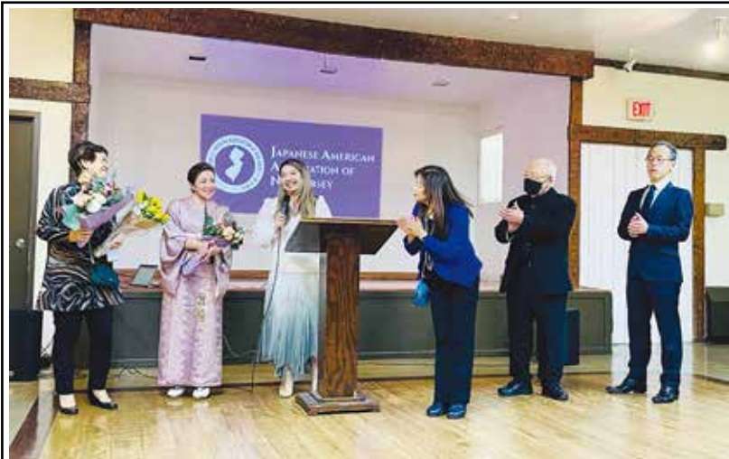
新体制発表に伴い新旧役員の交代を紹介