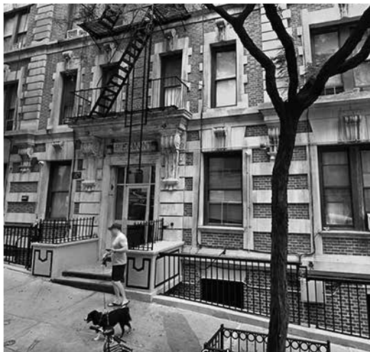
殺害事件が起きたアパート（グーグルマップより）

ハドソン・リバー・パーク・トラストは、マンハッタンにハドソン・リバー・パーク内にビーチを今年度の夏までにオープンする予定だ。公園内のガンズヴォート・ト半島、ガンズヴォート・ト半島、ガンズヴォート・ト半島の間に、1万4000平方フィートの砂浜が設置される予定。 このビーチは、数年前から建設が進められていた同半島の開通工事の一環である。同信託によると、この半島はハドソン・リバー・パークで最大の公園スペースとなり、広さは5.5エーカーに及ぶという。 同信託によると、「水泳は禁止」だが、家族連れが海岸で日光浴を楽しみながら、印象的なウオーターフロントの景色を眺める。