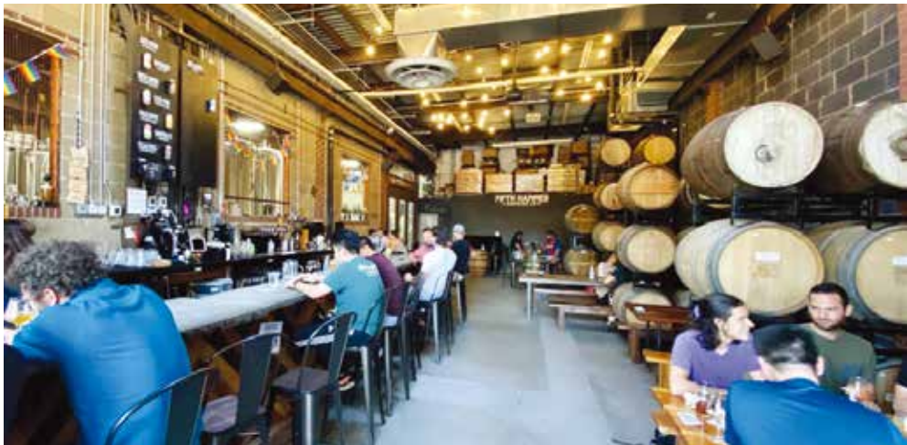
Fifth Hammer Brewing 10-28 46th Avenue Queens, NY, 11101 https://www.fifthhammerbrewing.com

ロングアイランドシティにある蒸留所「フィフス・ハンマー・ブリューイング」では、多種多様なスタイルの生ビールや缶ビールを季節ごとに取り揃えている。現在販売中の「ランウェイ・タートルズ」(滑走路の亀)は、キウイ、マンゴー、スライフルーツ、イチゴ、桃、砂糖漬けのミカンの皮などを使い、フルーツの香りとクリーミーな口当たりが特徴の人気商品。ユーモアのあるこのビールの名称は、ジャマイカ湾に生息し、巣作りシーズンには JFK 空港の滑走路に侵入するダイヤモンドバック・テラピンという亀に敬意を表して名づけられた。港湾局の報告によると、2016年の営巣シーズンには500匹以上の亀を滑走路から運び出したという。16オンス缶(9ドール)持ち帰り用4本セット(20ドル)で販売中。22日(水)午後5時から10時まで、たこ焼きイベントも予定されている。