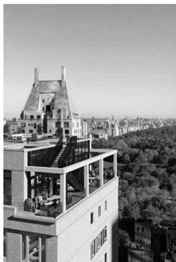
Photo : One11 Residences at Thompson Central Park