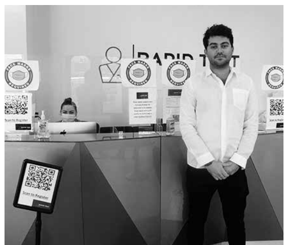
インタビューに答えるグルバークさん(撮影時以外はマスク着用)

参加申し込みサイト https://us02web.zoom.us/webinar/register/WN_