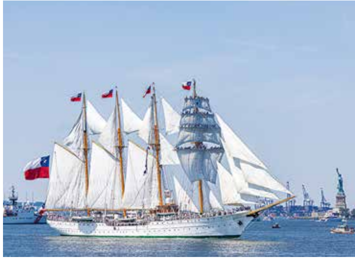
自由の女神横を通過する豪華な帆船