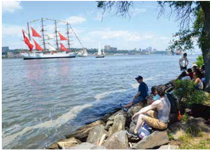
川辺で帆船パレードを楽しむ市民たち

あめりか時評 閑話休題 冷泉彰彦 独立以降の米国は欧州からの移民が基盤を作ったところから、ヨーロッパ文明圏が新大陸に進出したに過ぎないという言い方は可能だ。だとすれば、米国が独自の文明を持つというのはい。けれども、2度の世界大戦を経て世界の盟主へと米国を押し上げたものは、やはり米国の独自文明であつた。