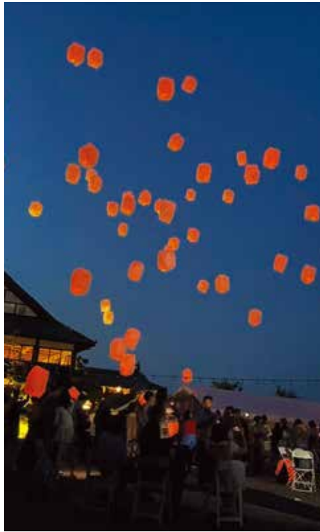
昨年の様子/撮影・本紙久松

から参加したい、一日中楽しみたい、という全てのニーズに対応できるプログラムを企画しているようだ。参加費は無料。食べ物やゲームコーナーなどは有料。問い合わせは、info@japani.org