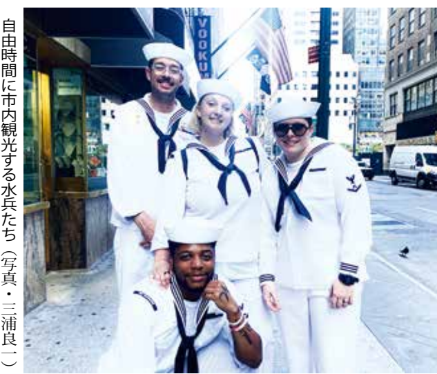
自由時間に市内観光する水兵たち

米国の独立記念日となった4日、ニューヨークでは建国250周年を祝う大規模な記念行事が朝から夜まで繰り広げられた。中心となったのは、ニューヨーク港を舞台にした帆船パレードと、夜のメイシースタジアムで、マンハッタン・ブルックリン、ジャージーシテイ、ホーボークンなど水辺の観覧スポットには、多くの市民や観光客が詰めかけた。日中には、米海軍のブルーエンジェルズを先頭に、米軍や同盟国の航空機による大規模な飛行ショーが行われた。あわせて、世界各国から集まった帆船や艦船がニューヨーク港からハドソン川へ進むパレード「セイル・フォース250 (Sailthru 250)」を実施した。帆船パレードは1976年の建国200周年や、自由の女神100周年を祝った1986年の大規模海上行事を思わせる演出で、港町ニューヨークの歴史を印象づけた。夜には、恒例のメイシ