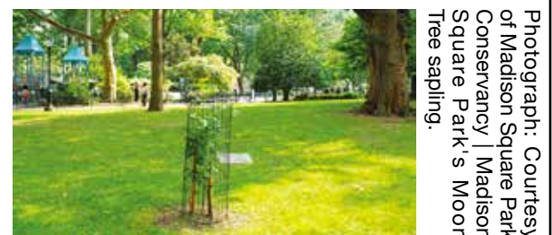
Madison Square Park's Moon Tree sapling.

マジソンスクエアパークは16日、同公園で育てているアメリカン・スイートガム (モミジバフウ) の誕生日を祝う無料イベントを開催する。この若木は2022年に米航空宇宙局 (NASA) のアルテミス I 計画で宇宙船オリオンに研究のために搭載された種が育ったもので、NASA がSTEM教育推進を目的に米農務省 (USDA) 森林局と提携し、23年に「ムーン・ツリー」配布を公募。学校や図書館、博物館などが100以上の機関、施設が当選し種を受理した。管理団体が選ばれ、25年4月にNY市内で2本目のムーン・ツリーとしてアラガット・ローンに植えられ