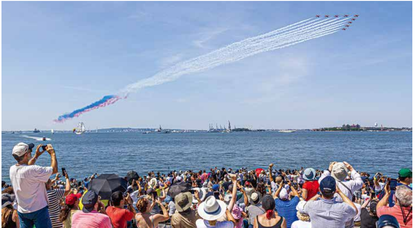
大勢の市民が見守る中、ハドソン川上空を飛行した各国精鋭のアクロバット航空隊の戦闘機