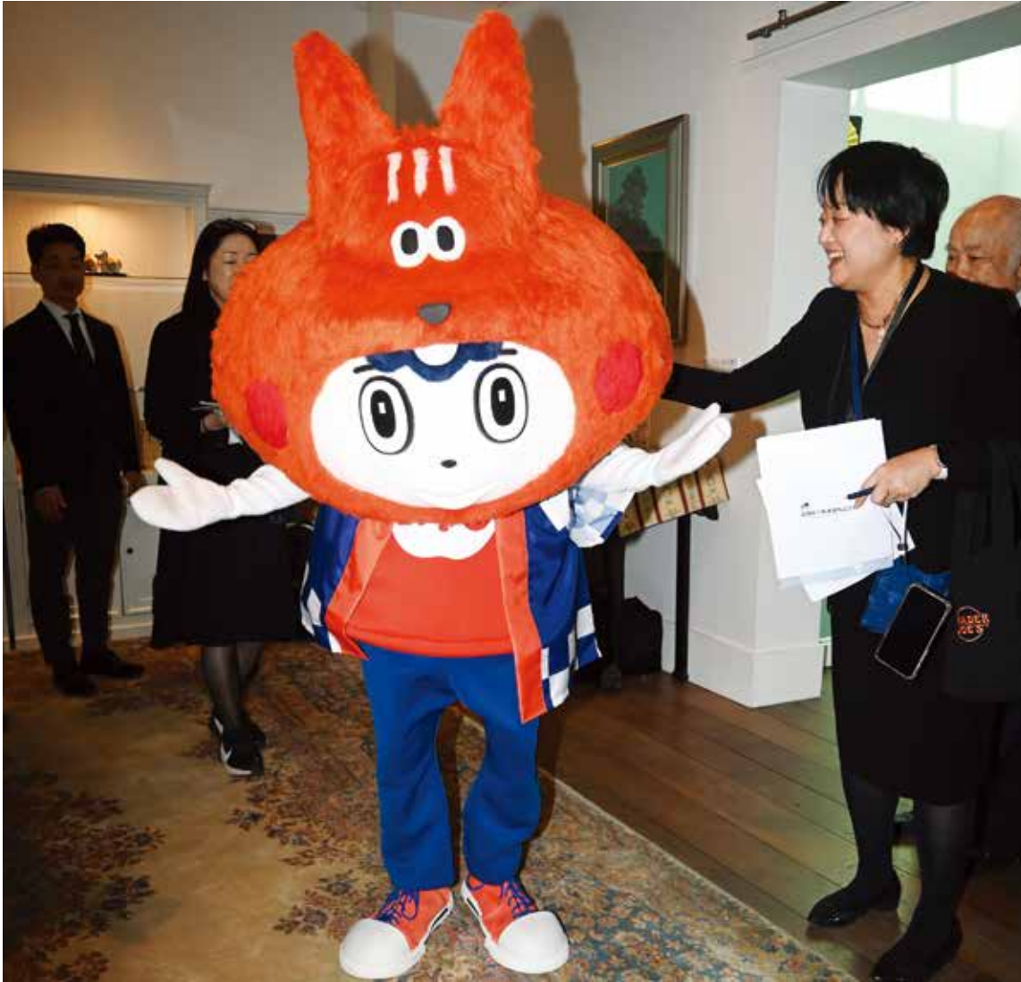
5月9日に開催されるジャパンパレードのプレビューイベントで姿を現した Happi (21日、NY 総領事公邸で)

新聞と同様にタブレットで読むデジタル版 www.nyseikatsu.com 世界のニュースもNYの今が分かる日本語新聞 (フリー) ©All copyrights reserved to New York Seikatsu Press, Inc.