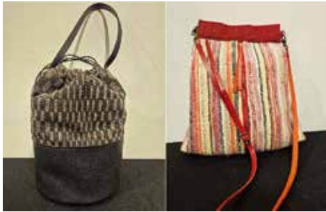
(左)「KURO ショルダーバッグ」32×20×20cm (右)「Pink!! ポシェット」33×30×3cm

■日本クラブ WEB ギャラリー常設アーティスト 有川道子「裂き織りアーティスト」 井上洋子「バッグデザイナー」