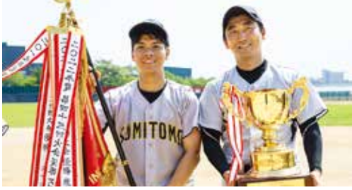
2025年度優勝チーム・米州住友商會社

毎年恒例の日本クラブ主催軟式野球大会は、5月初旬より予選リーグ制のトーナメントをランドールズアイランド球場にて開催します。初参加のチームも大歓迎ですので、社内で有志を募ってチームを結成してぜひご参加ください。2~5社で合同チームを作成するのも可能です。人数が足りないチーム、1人だけど参加したい方などは、まずはお相談ください。お問い合わせは info@nipponclub.org まで。