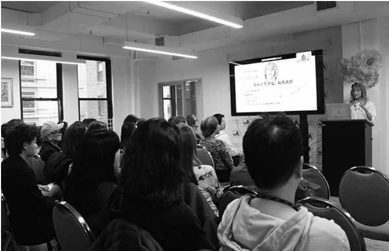
講演を熱心に聞く参加者(19日、NY日系人会で)