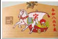
丙午の絵馬とストラップ

神が馬に乗って現れるという信仰に基づき、祈願時(特に雨乞い・晴れ乞い)に生きた一神馬(しんめ)を奉納していた。そして現在でも神事などで引き継がれている。一方、貴重で高価である生きた馬は世話も大変だったため、一般の人々が奉納することはとうとう不可能だった。その代わりに馬の絵を木の板に描いて奉納したのが「絵馬」の始まりとなる。その最古の事例で、奈良時代の『続日本紀』などに記述があり、奈良県の遺跡からは天平時代(8世紀)の木製絵馬が出土している。さて、現代の私たちは、