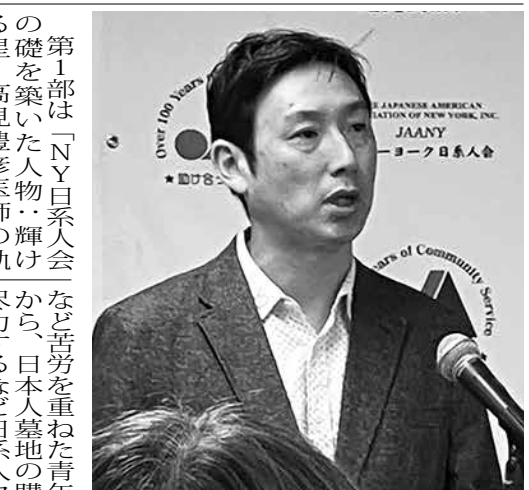
映画の制作について語る青松氏

第1部は「NY日系人会の礎を築いた人物・輝ける星 高見豊彦医師の軌跡」。高見博士(1875-1945・写真内)が15歳で渡米を決意して家出同然で熊本を出て渡米する