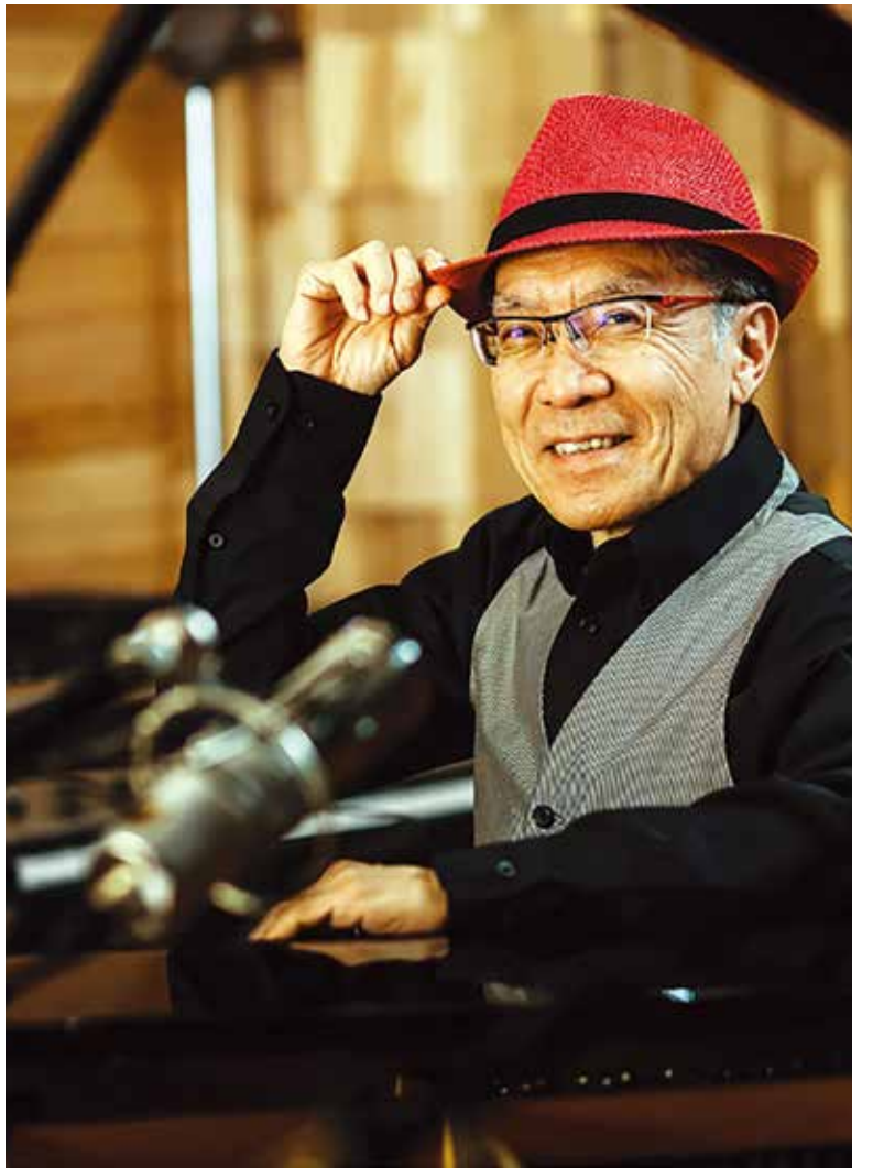
ジャズ・ピアニスト