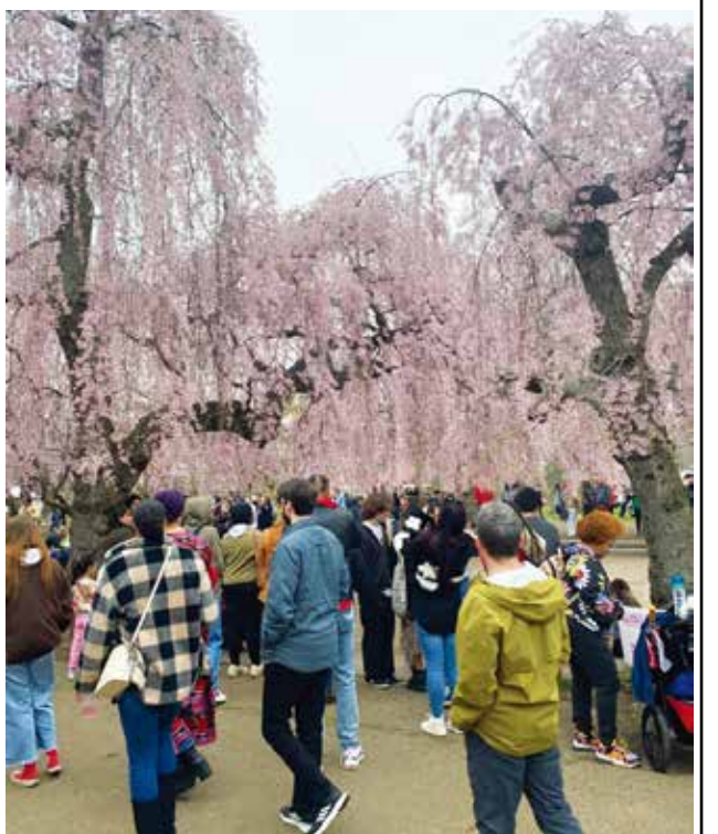
100年前(1926年)に日本政府がアメリカ独立150周年を記念して、フィラデルフィア市に寄贈した枝垂れ桜

フィラデルフィア日米協会主催のスバル桜まつりが、3月28、29日、フィラデルフィアのフェアモントパークで開催された。総勢約2万3000人が参加し、春の風物詩を満喫した。今年も例年より少々早めの開催となり桜は三分咲きだったが、両日会場は、桜花爛漫と言わなければかりに大勢の参加者で賑わい、華やかに和風が舞う週末となった。