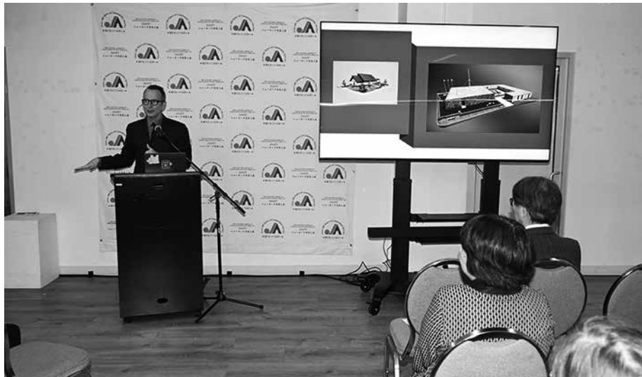
1939年と64-65年にNYで開催された万博日本館の説明を熱心に聞く参加者