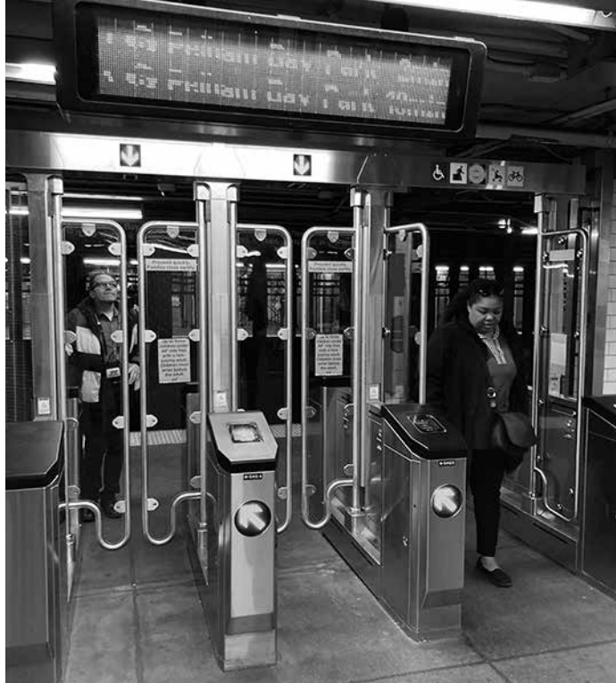
無賃乗車防止のための対策が施された新型の改札口(3月31日、地下鉄6番線23丁目駅で本紙撮影)

ないよう、同局がデータを匿名化したと述べた。MTAが「駅1」として、不正乗車率が最も大きく低下した駅では、不正乗車率が5.1%から4.6%へと70%減少した。デザインはそれぞれ異なるが、3つの最新型改札機モデルはいずれも、乗客がOMNYリダイで料金を支払うとガラス扉が閉き、通過してから数秒後に閉じる仕組みを採用している。