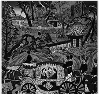
Exhibitionist Japan The Spectacle of Modern Development Angus Lockyer

の観点からどのように活用し、激動の20世紀を乗り切ろうとしたかについても解説した。ニューヨーク日系人歴史デジタルミュージアムは、1860年以降のニューヨークにおける日本及び日本人に関する歴史資料(文書、写真、映像、書簡、報道等)を検索・閲覧できるバーチャルミュージアム。これらの資料は、政治、外交、ビジネス、科学、文化、教育、スポーツ、メディア、移民など多岐にわたる分野にわたって、今日の強固で揺るぎない日米関係の背景には、ニューヨーク地域における数多くの日本人、日系アメリカ人、そしてアメリカ人の語られてこなかった物語がある。同ミュージアムはそれらの人々に光を当て、記憶し、認識し、顕彰することを目的としている。講師のアンガス・ロッキ