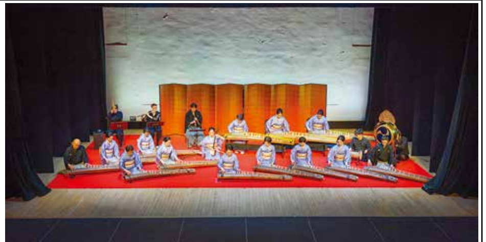
宮城合奏団とコロンビア大学雅楽アンサンブル・メンバーによる「越天楽変奏曲」の演奏。