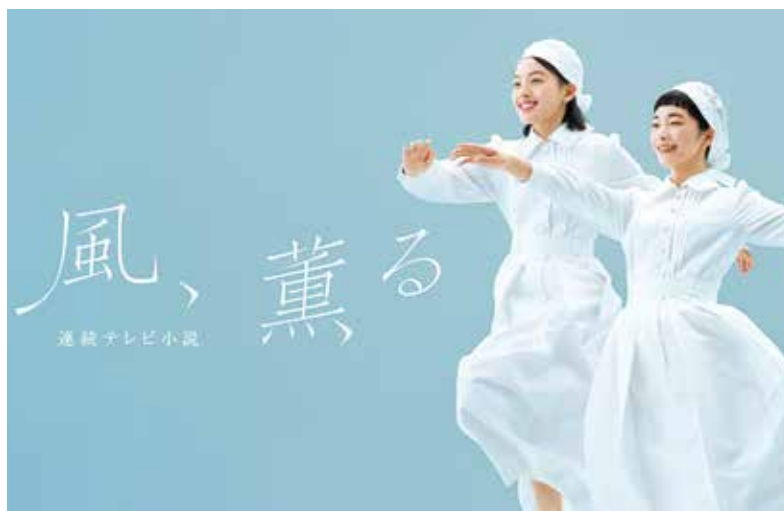
風、薫る 連続テレビ小説

日本のニュースやドラマ、映画などが定額見放題で楽しめる動画配信サービスJme(ジェイミー)は、ウェブサイトを( https://watchjme.tv )からの新規加入で5日間無料トライアルを実施中。