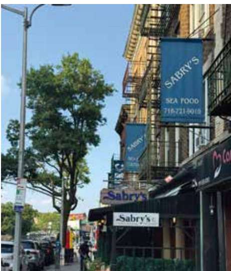
知なるNY市内を元気に探索中。

い上がり、夜の帳が下りると一層賑わう印象でした。ひと時の異国情緒を味わえるかと思えます。プロフィール兵庫県明石市出身、ウエストチェスター在住。週末の街歩きグループと共に、未