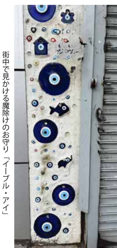
街中で見かける魔除けのお守り「イーブル・アイ」

ア・ブルバードと28アベニュー周辺の区間で多様な文化や料理が楽しめます。まず、この通りで目を引くのは、アストリア・ブルーバードのほど近くにあるモスク、マズジッド・ア