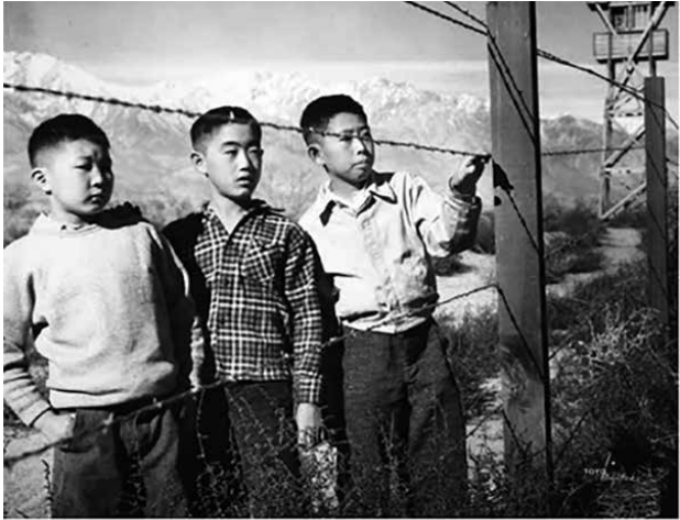
(Three Boys Behind Barbed Wire, Manzanar Internment Camp)