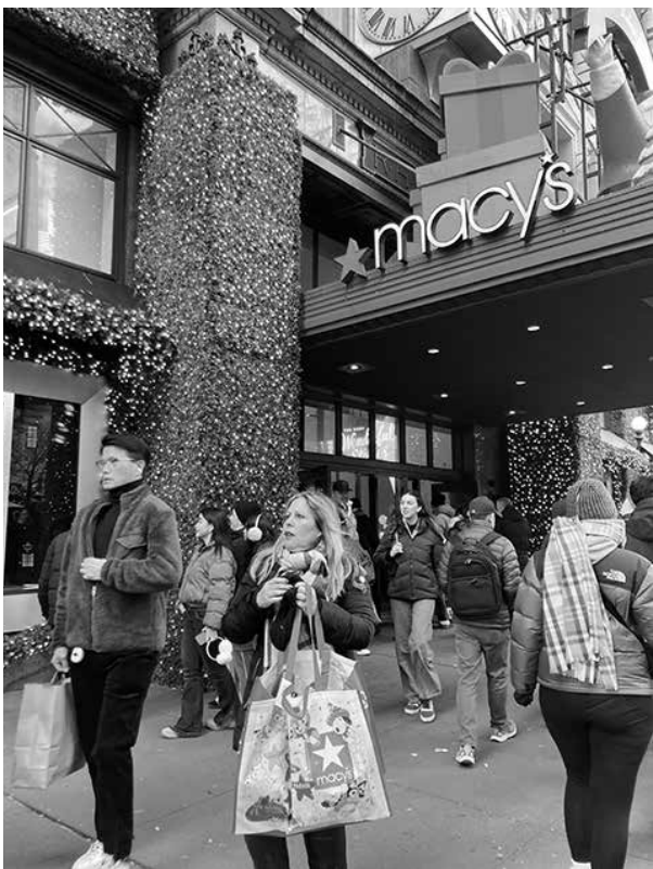
かつてほどの大混雑が見えないメイシーズ(28日午前)

米国の感謝祭セールでオンライン消費が過去最高を更新した。アドビ・アナリティクスによると、11月27日の感謝祭のオンライン売上は64億ドル(約9900億円)、翌28日のブラックフライデーは118億ドル(約1兆8300億円)と前年から約9%増えた。寒波や物価高の影響で店舗よりネットを選ぶ傾向が強まり、AIを使った価格比較ツールやスマホ経由の購入が拡大したという。