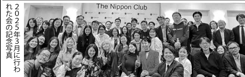
2025年3月に行われた会の記念写真

日本クラブとニューヨーク日本商工会議所(JCC)の共催で8月26日、ボストンの北に位置するケンブリッジにある最先端のイノベーション施設、CICケンブリッジ(Cambridge Innovation Center)とMITスローンスクール(MIT Sloan School of Management)を巡る日帰りバスツアーが開催され、約30人が参加した。このツアーの目的は、日系スタートアップと日系企業の経営層に、ボストンにおけるイ