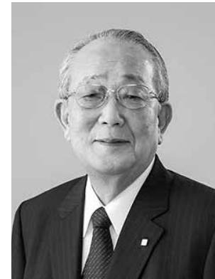
稲盛和夫 Inamori Kazuo

1932年-2022年 鹿児島市生まれ。1959年4月、京都セラミック株式会社（現京セラ）を設立。2005年からは名誉会長。また1984年、第二電電企画株式会社を設立。2000年10月、DDI（第二電電）、KDD、IDOの合併によりKDDI株式会社を設立。2001年6月より最高顧問。2010年2月、日本航空会長に就任。2015年4月に名誉顧問。一方、1983年から2019年末まで、ボランティアで、14,938人の経営者が集まる経営塾「盛和塾」の塾長として、経営者の育成に心血を注いだ。1984年には私財を投じ稲盛財団を設立。同時に国際賞「京都賞」を創設し、毎年、人類社会の進歩発展に功績のあった方々を顕彰。