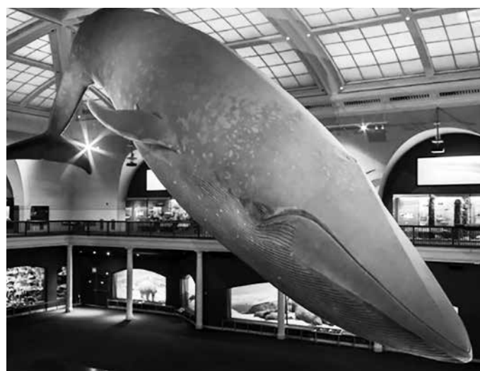
Blue Whale at the American Museum of Natural History

建国の父アレクサンダー・ハミルトンが居住したことで知られるハレームの西部、ハミルトンハイツ。このエリアには歴史にちなんだエピソードが沢山残っている。1920年代にはハレーム・ルネサンスの中心地として数々の文学、音楽、アート、思想を輩出。ネオゴシック様式の傑作として知られるステイ・カレッジのキャンパスを筆頭に20世紀初頭の著名な建築物が数々残る特別なエリアである。 だが1930年に起きた世界大恐慌はこのエリアを不穏なものに変えてしまう。市の財政が安定せず、このエリアには大家によって維持が放棄された建物が目立ち始める。そして監視するものをもたないそれは様々な犯罪の温床へと変化する。状況は悪化していく中、1990年代にニューヨーク市がこのエリアの改善やコミュニティ活動に予算を投与。こうして少しずつこのエリアは息を吹き返していった。 そして現在のハミルトンハイツには穏やかな空気が流れている。安全で住みやすい街になった。ステイ・カレッジ前のカフェやレストランを行き来する周囲の学生達がこの街に良いリズムとヴァイブを与えている。 コンベント・アベニュー沿いに咲く桜はこの街に起きた変化を見続けてきた。ハミルトンハイツは長い眠りから目覚め、静かに2度目のルネサンスを迎えているのである。