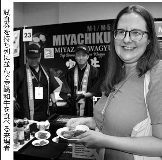
試食券を持ち列に並んで宮崎和牛を食べる来場者