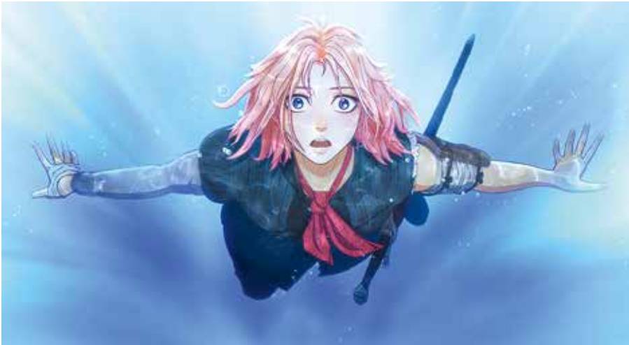
『果てしなきスカーレット (SCARLET)』