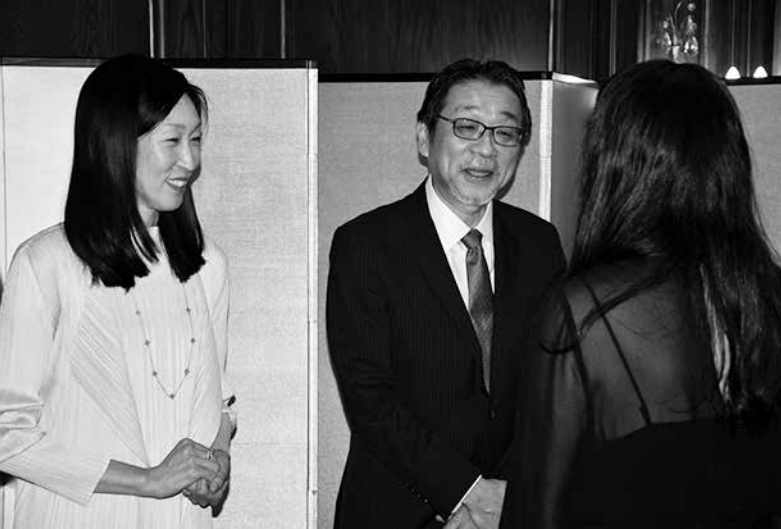
招待客に挨拶する森大使夫妻

今回の大統領令は、新規にH-1Bのビザを取得する採用社員の場合に適用され、現在同H-1Bビザを所有している人は対象外だが、日本人を含めた外国人の米国就労ビザの取得が一段と厳しさを増すことには変わりはないとみられる。