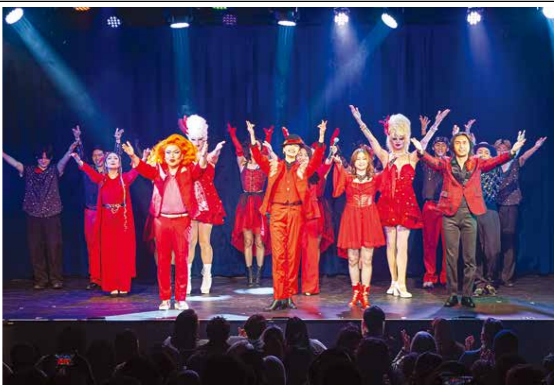
フィナーレで満場の拍手を受ける出演者たち (13日)

スボだ。栗岡は、過去20年に渡り、白黒フィルムの写真作成時代を経て、現在は色で彩られた自然界および人間界の美を写真を通して表現している。今回の作品『Lost in Culture』は、人間界の日常の生活の中で、彩りと光が織りなす非日常的な美および異国文化の中で感じ取る美を表現した作品シリーズ。