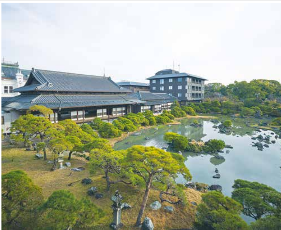
江戸時代、柳川藩主立花家の邸宅として建てられた屋敷を改装した「御花」

都港区六本木5丁目(麻布区)に位置し、国際相互理解のための文化交流、及び知的協力の促進を目的とする公益財団法人(公益財団法人国際文化会館)及び同法人が運営する施設で、会議室、ホール、レストラン、図書室、宿泊室を兼ね備えている。また、港区の名勝に指定され、都会のオアシスと誉えられる日本庭園は、1年を通して四季折々の景観が楽しめる。