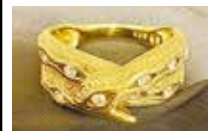
蛇リング18K ダイヤモンド 老長寿の力を発揮

テイのことで、よどみなく流れる水のように弁舌がさわやかであるとの連想から「妙音天」「弁才天」「大弁功徳天」と意識される。いわゆる流れるもの全てをになう「言葉・弁舌や知識、音楽など」女神のことで、日本には仏教伝来時に『金光明最勝王経』を通じて中国から伝えられた。こ